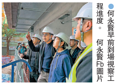
●何永賢早前到場視察工程進度。

香港文匯報訊(記者文森)繼元朗攸樂路的全港首個簡約公屋項目日前開始分階段入伙後,特區政府房屋局局長何永賢昨日表示,不少市民也對緊隨其後的其他項目相當期待,而牛頭角彩興路簡約公屋項目的建造工程亦已到最後階段,最後一個MIC(組裝成)組件已於3月22日完成吊裝,而位於石硤尾的彩興路簡約公屋辦事處亦在上周四(3月27日)開始運作,將全力處理相關申請的資格審核。