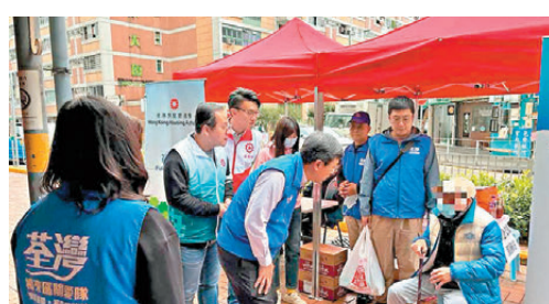
●關愛隊隊員與義工主動向有需要人士了解情況。

協會會員調查顯示,半數受訪會員展望3月生意持平及微升,較以往只有一成會員稱生意持平或微升,情況好轉,當中便利店、化妝品及超市生意有單位數升幅。