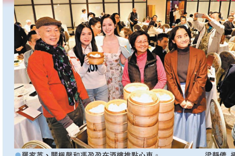
●羅家英、關楓馨和馮盈盈在酒樓推點心車。