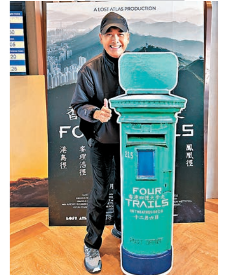
●周潤發看過電影《香港四徑大步走》都激讚。 資料圖片

已經取得一定成績的香港新銳導演陳小娟則希望能繼續拍出更多讓觀眾喜歡的各類型作品。