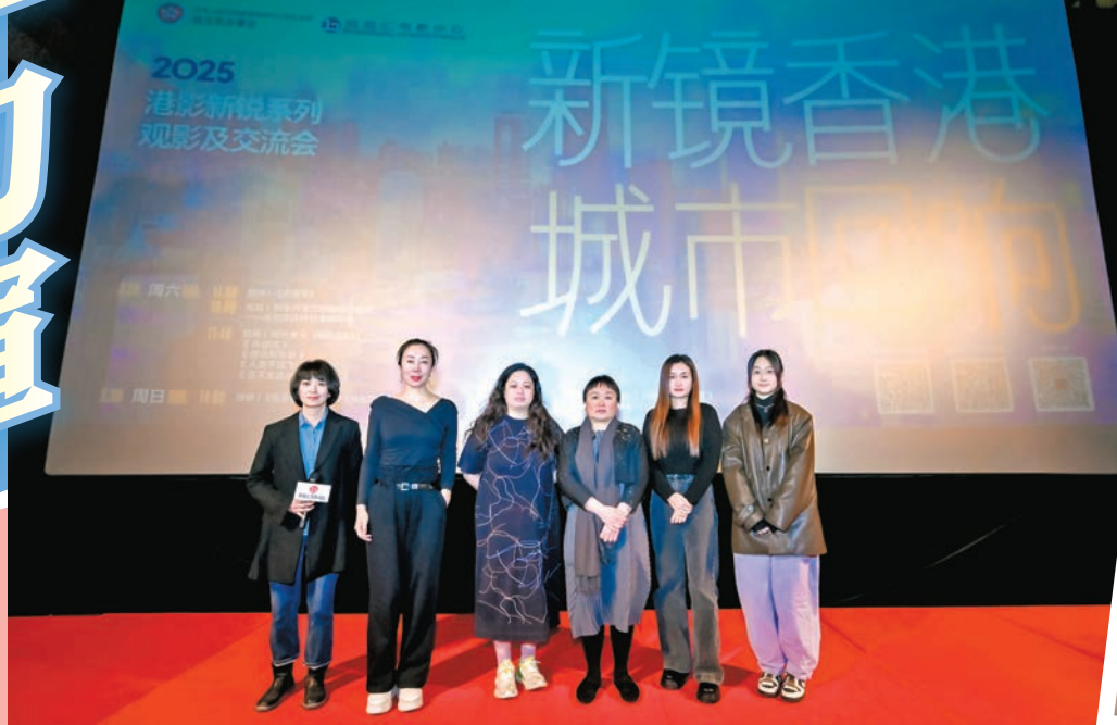
●香港新銳導演代表及與會嘉賓在開幕式上合影。