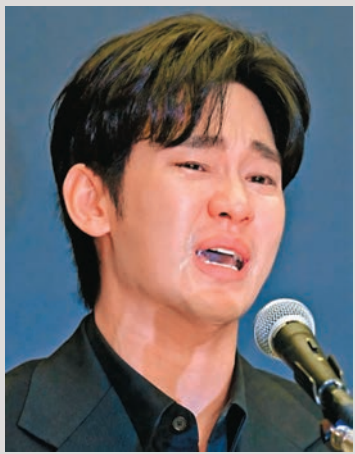
●金秀賢在記者會上一度聲淚俱下。

香港文匯報訊（記者 凡文）韓國男演員金秀賢深陷跟已故女星金賽綸的交往爭議，在隱身21天後，昨日他由律師陪同下舉行記者會，並以「宣讀」形式說明此事件，媒體提問則被禁止。在發表聲明期間，他一度情緒激動，聲淚俱下。