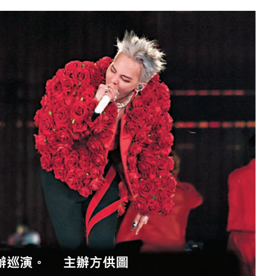
●GD時隔8年再辦巡演。