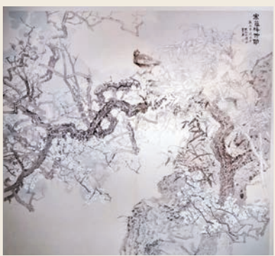
●莫曉松作品《寒蕪梅竹勁》

步入國家大劇院藝術館西廳，由中國美術家協會主席范迪安題寫的「大道同工」赫然眼前。在經過藝術家簡介的板塊後，隨即就是一座工筆畫的殿堂。只見一幅幅作品或細膩入微、神氣活現，或抽象寫意、獨具風神。憨態可掬的老虎、飽滿豐腴的唐人、團團錦簇的花籃……無不令參觀者駐足讚嘆。