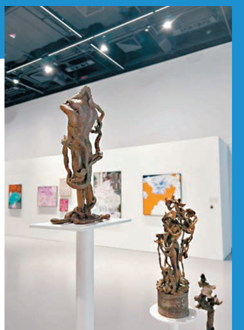
●已故藝術家麥顯揚以青銅為媒材創作的作品。