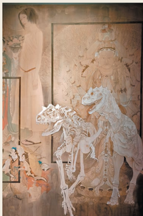
●王穎生作品《踱步之三》