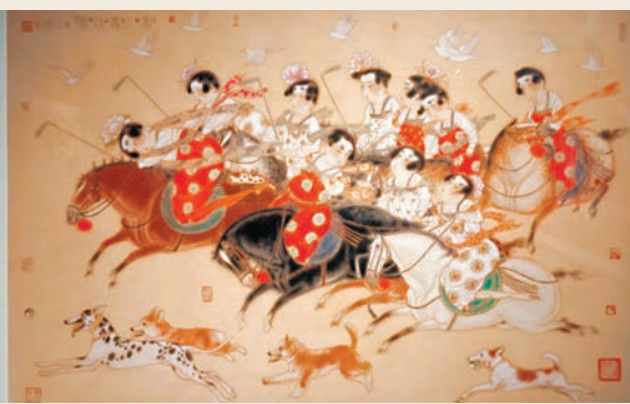
●唐勇力作品《唐人馬球圖》