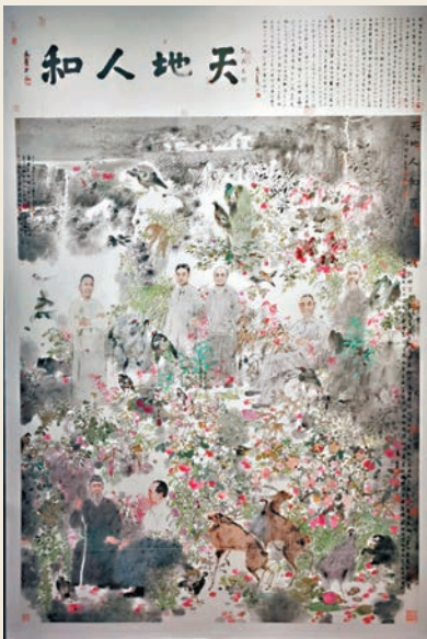
●盧禹舜作品《天地人和 百家和鳴》

七位畫家在人物、花鳥走獸和山水畫領域深耕不輟數十年，在工筆畫題材、材料和技法上變革精進，藝術面貌雖各成一派，但創作都體現了對生活、自然、時代的體味，以及對工筆畫繼承與創新的思考。