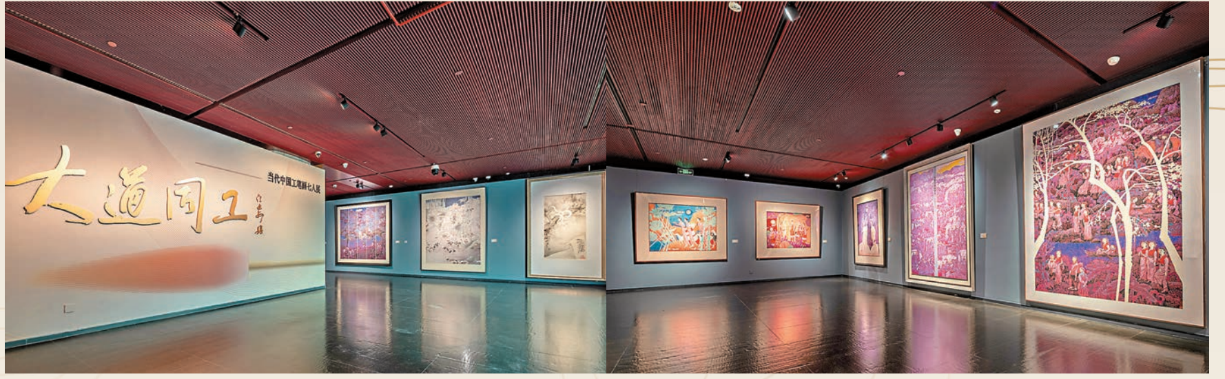
●「大道同工——當代中國工筆畫七人展」在國家大劇院正式開幕。