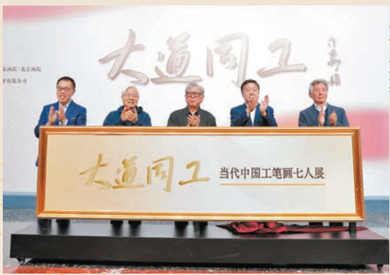
●左起：國家大劇院院長王寧，嘉賓蔡武、胡振民、何毅亭，中國美協主席范迪安為展覽揭幕。主辦方供圖