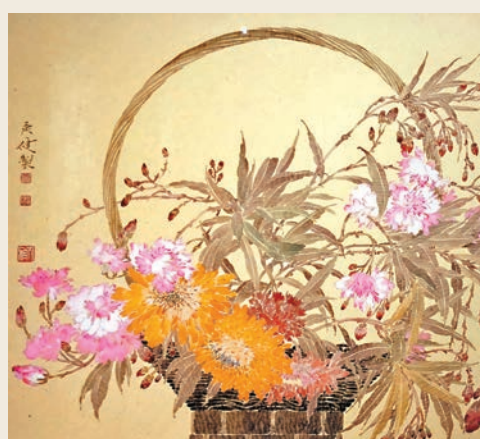
●賈廣健作品《盛世繁華》

在當代中國美術的發展中，工筆畫藝術葆有雄厚實力和蓬勃態勢，既在主題內容方面呼應了時代需求，又在結構形式方面探尋了審美表達，行之有效地完成了觀念和語言的當代轉換和創造。作為承載中華民族特有的精神品格與文化內涵的視覺載體，工筆畫彰顯出與時代同行的審美取向和萬象更新的藝術特徵。