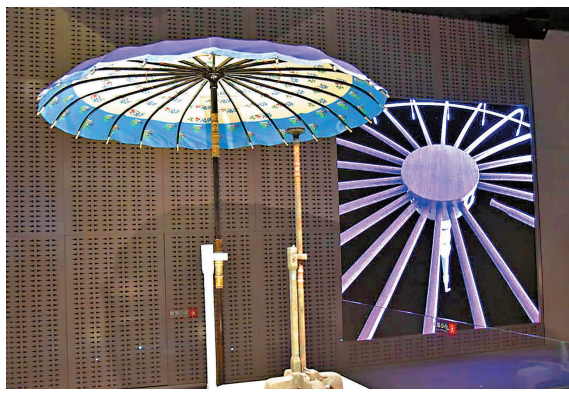
●圖為復原的銅車馬傘蓋。

兩車主要用青銅鑄造而成，通體施以彩繪，有雲紋、幾何紋、夔龍紋等圖案，紅、綠、紫、藍等色彩艷麗華貴，其形體之大，堪稱「青銅之冠」，加上重達14公斤的金銀飾品，價值更高。