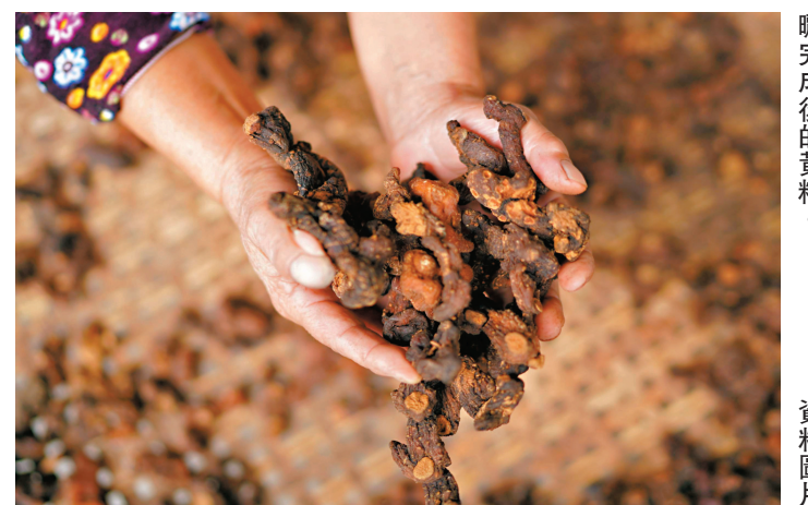
●黃精炮製後可製成多種食品。圖為蒸曬完成後的黃精。

●葉德平博士，香港教育大學「文化傳承教育與藝術管理榮譽文學士」課程統籌主任、「戲曲與非遺傳承中心」副總監，曾出版多本香港歷史、文化專著。