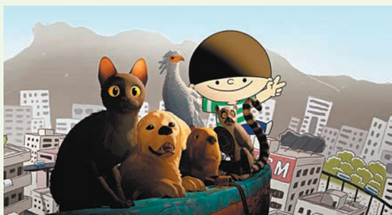
●《牛仔返嚟喇!》x《貓貓的奇幻漂流》百老匯院線獨家聯乘上映。

尤其令人動容的是，這艘「動物方舟」上的成員並非完美無缺：黑貓敏感多疑，金毛犬盲從依附，狐猴貪婪自私，蛇鷲背負創傷。然而，正是這些缺陷讓牠們的成長互補不足。例如：黑貓從獨善其身