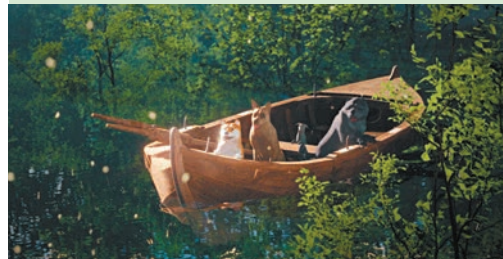
●不同的動物穿越異域仙境，共同面對汪洋中的挑戰與危機。