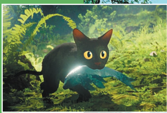
▲《貓貓的奇幻漂流》拿下奧斯卡金像獎最佳動畫。