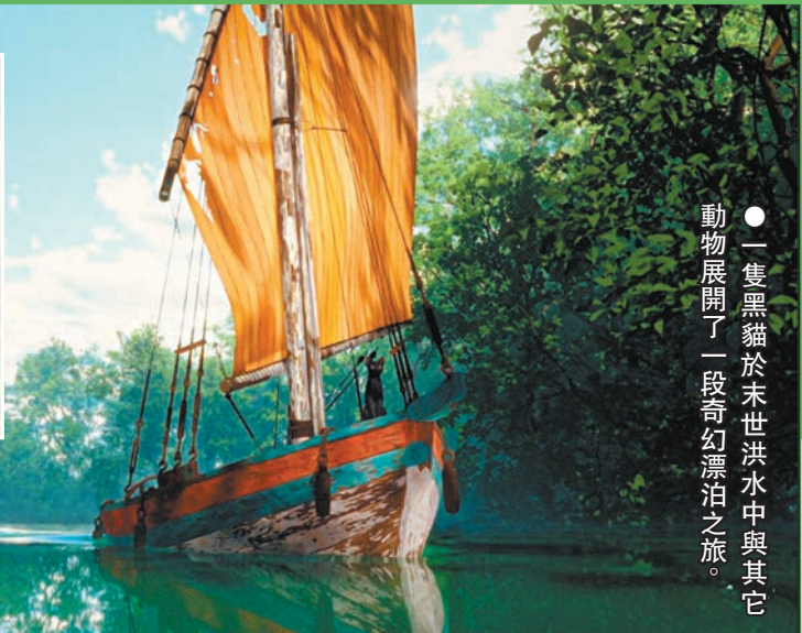
●一隻黑貓於末世洪水中與其它動物展開了一段奇幻漂泊之旅。

動畫片《貓貓的奇幻漂流》最引人注目的特點在於它能夠徹底拋棄傳統動畫的擬人化對白。全片只依靠動物的本能行為、大自然音效與視覺符號交代每個劇情。這種創作手法看似冒險，卻意外地解放了觀眾的想像力。例如：黑貓與野狗的「食物爭奪戰」中，鏡頭以手持式視角模擬追逐的動感，透過肢體語言與環境互動，無須一句台詞便清晰傳達出生存競爭的緊張感。這種來自大自然的純粹，令電影超越了文化與語言的阻礙。