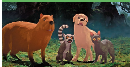
●狐猴與狗也參與演出。