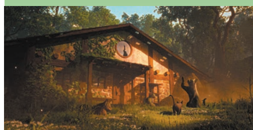
●《貓貓的奇幻漂流》明日在港上畫。