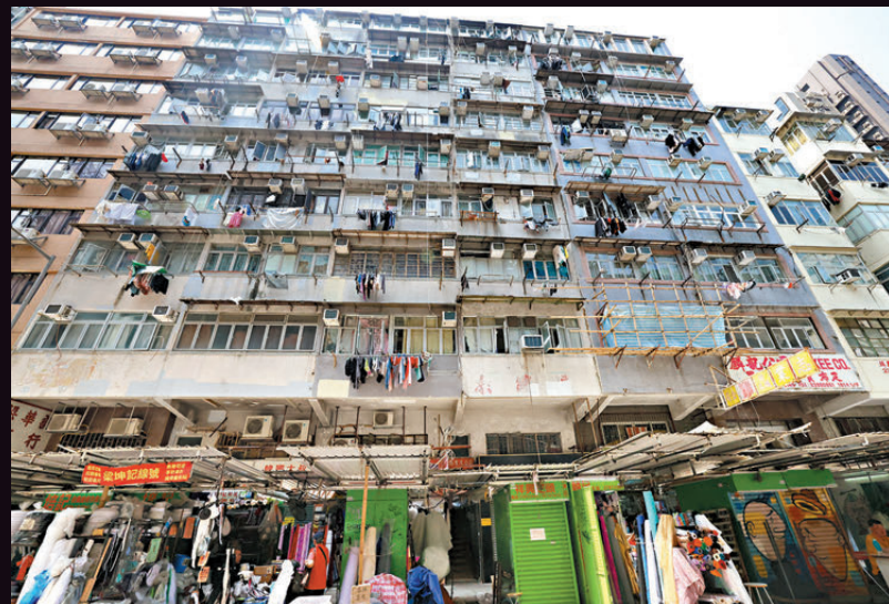
●現場為深水埗基隆街175號一棟舊式唐樓大廈，大廈梯間的大量生活垃圾佔據大半通道及發出惡臭。