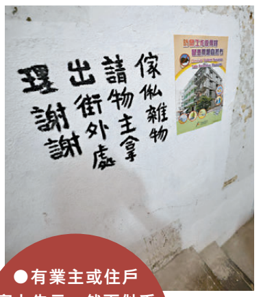
●有業主或住戶寫上告示，然而似乎並無作用。

他相信，「聯廈聯管」會是一個契機，解決這種無人組織法團的情況，但最後最好還是有業主願意參與，政府及地區人士才能和他們合作，從根源解決問題。