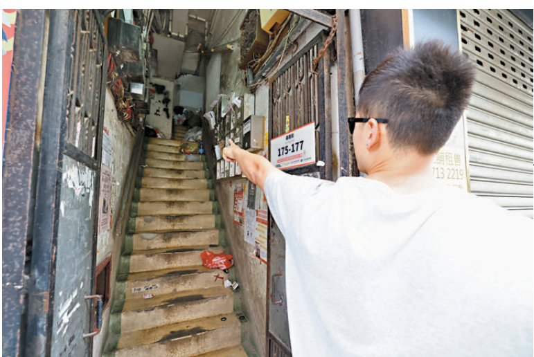
▲林先生指有住戶隨手將垃圾包括初生嬰兒的尿片丟在梯間。