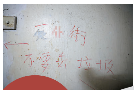
●有住戶留下警告標語，怒意「躍然牆上」。