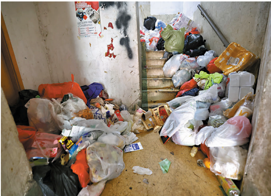
▲梯間堆積大量生活垃圾無人清理，散發惡臭。