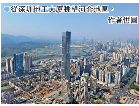
從深圳地王大廈眺望河套地區。