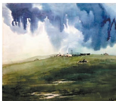
●《故鄉》46cm x 57cm 水彩畫。作者畫作

中學時，每到暑假我都會去哈彥忽洞蘇木(鄉的意思)，那裏有父親做公安特派員時的好朋友劉才英大爺和趙發叔叔，趙發叔叔有5個女兒，所以我喜歡住在劉大爺家，因劉大爺家有新年和萬年哥可以一起去放羊，每天早帶上水和乾糧和兩個哥哥一起去放羊，我也帶着畫畫的工具，畫些羊、馬、牛和草原上的花草草的寫生，兩位哥哥則順便採一些草原上的野菜、野沙蔥，傍晚時才把羊趕回家，家裏大娘已做好了晚飯，我們一邊吃着美味的羊肉一邊聽着收音機，睡前再去做暑假作業，也會躺在草原上凝視天上浩瀚的銀河系，滿天星辰數不勝數，整個暑假過得非常充實。有時寒假也會去看看大爺大娘、趙叔兩家人，住上一個星期，至今想起，心裏滿是美好的回憶！