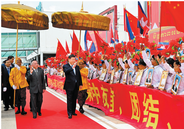
●當地時間4月17日上午，國家主席習近平乘專機抵達金邊。這是習近平向歡迎人群揮手致意。

●加快建設面向和平與繁榮的湄湄國家命運共同體，攜手建設和平安寧、繁榮美麗、友好共生的亞洲家園。共同反對霸權主義、強權政治、陣營對抗，捍衛兩國和發展中國家共同利益，倡導平等有序的世界多極化、普惠包容的經濟全球化，致力於維護世界和平穩定和國際公平正義，共同抵制保護主義，維護開放合作的國際環境。