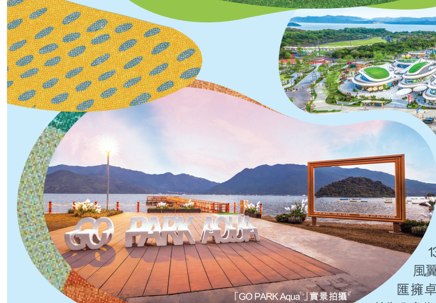
「GO PARK Aqua ® 」實景拍攝

鄰近全新水上活動中心「GO PARK Aqua ® 」, 打造約 13萬平方呎特色海岸樂園, 可暢玩直立板、龍舟、獨木舟及 風翼衝浪等豐富刺激的水上活動。「SIERRA SEA」 匯擁卓越教育資源、豐富配套及海岸自然環境 ® , 蔚為全方位人士理想優居生活國度。