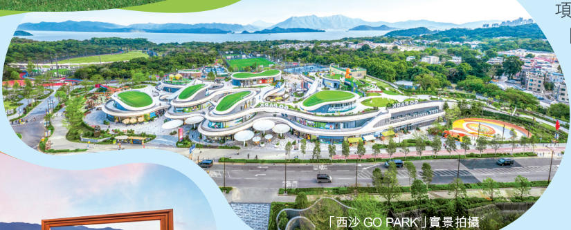
「西沙 GO PARK」實景拍攝

鄰近全新水上活動中心「GO PARK Aqua ® 」, 打造約 13萬平方呎特色海岸樂園, 可暢玩直立板、龍舟、獨木舟及 風翼衝浪等豐富刺激的水上活動。「SIERRA SEA」 匯擁卓越教育資源、豐富配套及海岸自然環境 ® , 蔚為全方位人士理想優居生活國度。