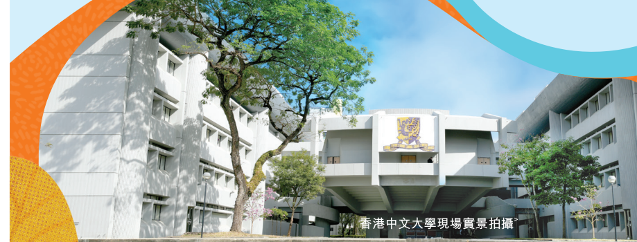
香港中文大學現場實景拍攝

新鴻基地產歷來最大型私人住宅發展項目 s ，其中率先登場的「SIERRA SEA」不僅坐擁港鐵「雙站x雙綫*」優勢，同時暢享西沙優質海岸度假式生活 t 。項目毗鄰運動商業綜合體「西沙 GO PARK u 」及水上活動中心「GO PARK Aqua v 」，並坐擁多達168項設施的巨型會所國度「Resorts World w 」。項目坐享優越的幼稚園及中小學教育資源 y ，更迅連香港中文大學等7間大學，造就全方位精英生活圈。