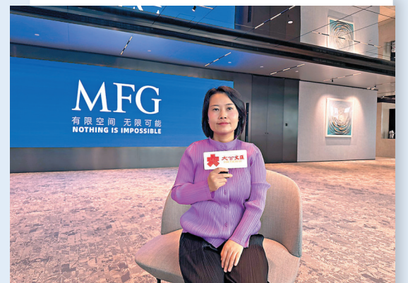
●香港文匯報記者早前參觀了MFG與聯想聯手打造的聯想後海中心辦公項目。

字樓辦公室的資產持有方。張會指：「我們與寫字樓資產持有方共建共享的『聯營合作』模式，根據不同資產的實際情況，進行產品規劃、整體升級改造、運營管理，共同提升項目品質的同時也實現了運營資產的保值增值。」