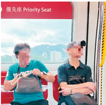
現時港鐵關愛座主要為長者使用。