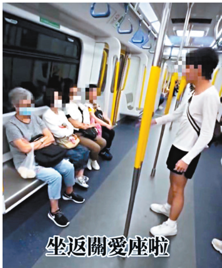
●日前網上流傳片段，有年輕人指責多名老婦坐港鐵普通座位，要求她們坐關愛座。 網上影片截圖