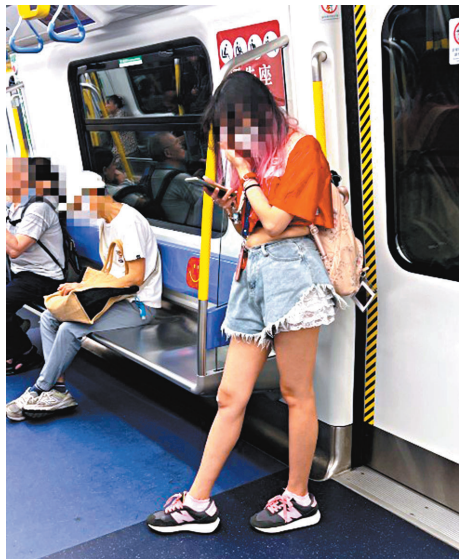
●不少年輕人寧願站立，也不願使用空置關愛座。