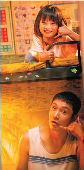
無聲勝有聲，充滿愛和力量。

由張藝興、李珞桉、黃堯、安洳、章若楠主演的《不說話的愛》，故事講述女孩木木（李珞桉飾）隨聾人父親小馬（張藝興飾）一同生活在聾人群體中，雖然從小在單親環境下長大，但小馬和他的朋友們給了木木幸福快樂的童年。直至一日，木木被母親強行帶入「聽人世界」後，一切發生了改變。這部作品亦成為了一面反映社會偏見的明鏡。