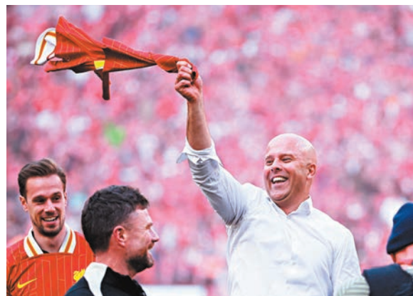
●史洛接手第一季即帶隊重奪英超冠軍。

利物浦最後憑烏龍球鎖定勝局，於全場逾六萬名球迷見證下以5:1大勝熱刺，雖然要等到最後一場主場才會在頒獎典禮正式捧盃，但當球證鳴笛後，晏菲路球場已經變成慶祝舞台，包括史洛在內的一眾利物浦球員一起唱歌跳舞，慶祝球會六季內兩度贏得英超冠軍，也是隊史第20座頂級聯賽錦標。上次因疫情面對空空如也的觀眾席慶祝，今次利物浦終於可與主場球迷一起開冠軍派對。