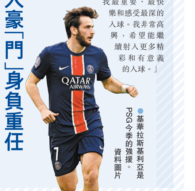
●基華拉斯基利亞是PSG今季的強援。

基華拉斯基利亞將隨隊於歐聯客阿仙奴，他表示出戰歐聯是每位球員的夢想，但要取得冠軍絕對不容易，「每家豪門都有能力贏冠軍，所以我們必須專注於自己的比賽，在比賽期間保持集中。」這位曾在歐聯8強首回合對阿士東維拉中取得入球的格魯吉亞國腳形容，該球是「最重要的入球」，「在主場，在球迷面前為球隊入球，這可能是我最重要、最快樂和感受最深的入球。我非常高興，希望能繼續射入更多精彩和有意義的入球。」