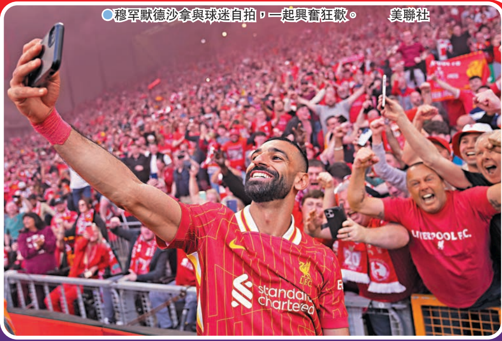
●穆罕默德沙拿與球迷自拍，一起興奮狂歡。