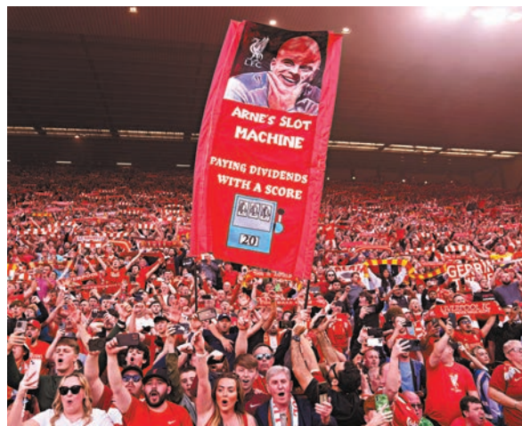
●球迷舉起史洛的旗幟唱歌歡呼。