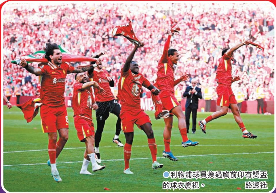
●利物浦球員換過胸前印有獎盃的球衣慶祝。

將於7月訪港的利物浦在周一凌晨的英超以5:1大勝熱刺，提前四輪鎖定英超冠軍。今次是利物浦在六個賽季內二度贏得英超，也是隊史第20座頂級聯賽錦標。「紅軍」主帥史洛賽後帶領球迷高歌，然而這上任首季便領軍重上高峰的功勳主帥，則在歌曲內將自己的名字變成高洛普，向這名前任傳奇領隊致敬。