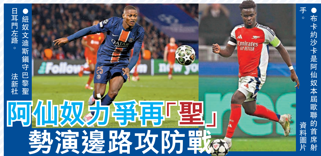
●紐奴文迪斯鎮守巴黎聖日耳門左路。