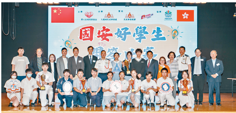
●高中組冠亞季軍和優異獎得主與頒獎嘉賓合照。

香港文匯報訊(記者 子京) 今年是香港國安法公布實施5周年，愛心全達慈善基金和九龍城民政事務處合辦、九龍城區中學校長會協辦的國安好學生問答比賽總決賽，昨日在啟德社區會堂舉行。來自九龍城區內的5間中學參賽，通過初中組及高中組國安知識問答比賽，深化對國家安全的認識。賽事競爭激烈，最終由余振強紀念中學連奪初中組及高中組的冠軍獎盃。