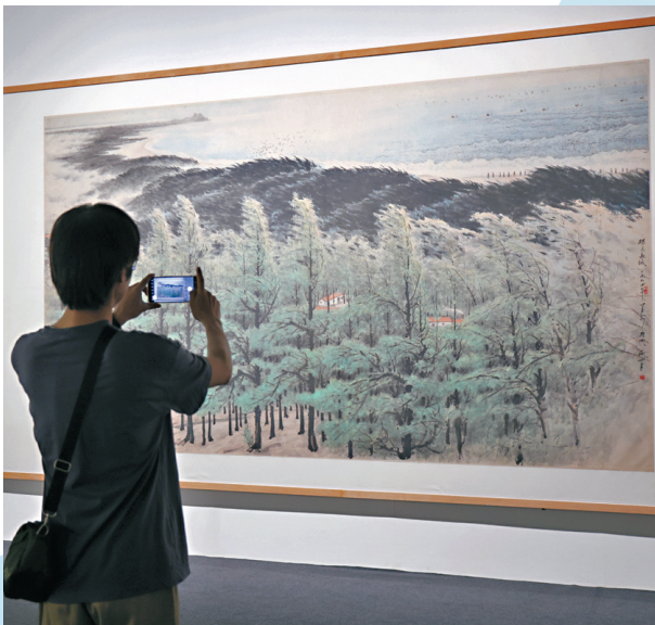
●藝術家作品令人耳目一新。