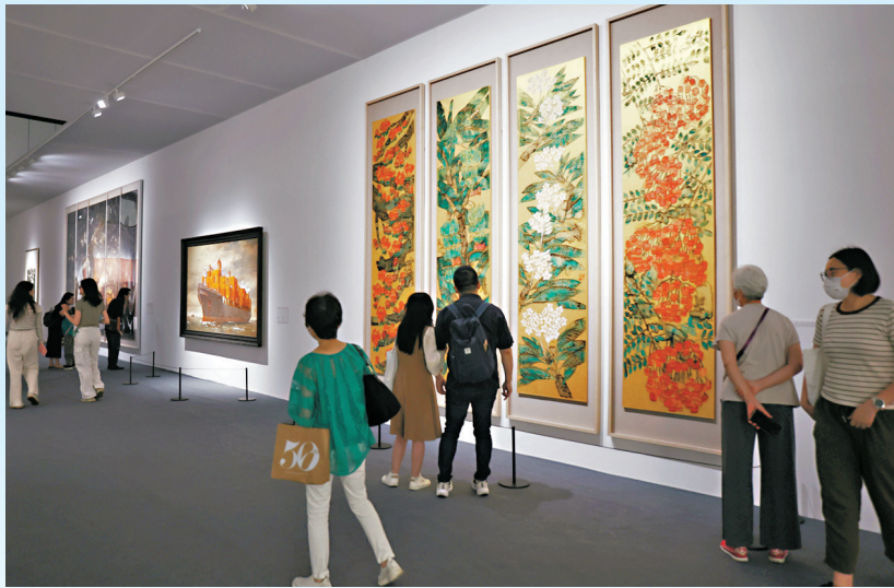
●不少本地市民和遊客到場觀展。

正於灣仔會展中心展出的「其命惟新——廣東美術百年大展」昨日迎來首個周末，吸引不少本地市民和遊客到場觀展。香港文匯報記者在現場所見，展覽場內人流不斷，參觀者都很認真地細看展覽內容。有大學生在觀展後表示，今次展出的藝術家作品令人耳目一新，令她感受到守正創新的民族精神，也為她的畢業設計提供了靈感。有國際遊客稱讚展覽令人印象深刻，從中了解到更多中國歷史，會向朋友推介香港。有香港文化界人士也專程來觀展，認為此次展覽難得之處在於系統梳理了廣東百年藝術脈絡。