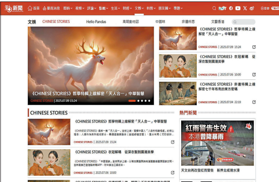
●中華文明系列動畫《Chinese Stories》

此外，新增國安教育資源也包括全球首部AIGC（人工智能生成內容）的中華文明系列動畫《Chinese Stories》，以多元角度介紹中華文明。動畫共有40集短片，分別以普通話、英語、法語三語版本說好中國故事，今年5月底起通過香港大公文匯傳媒集團的點新聞平台全球首發，主題包括龍舟競渡端午節、中國服飾、「天人合一」的中華智慧等。