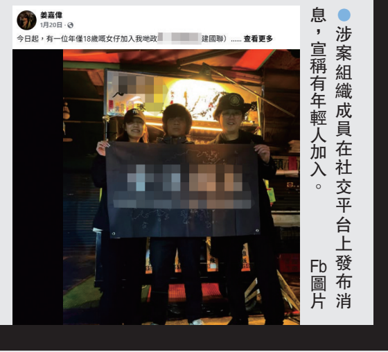
●涉案組織成員在社交平台上發布消息，宣稱有年輕人加入。