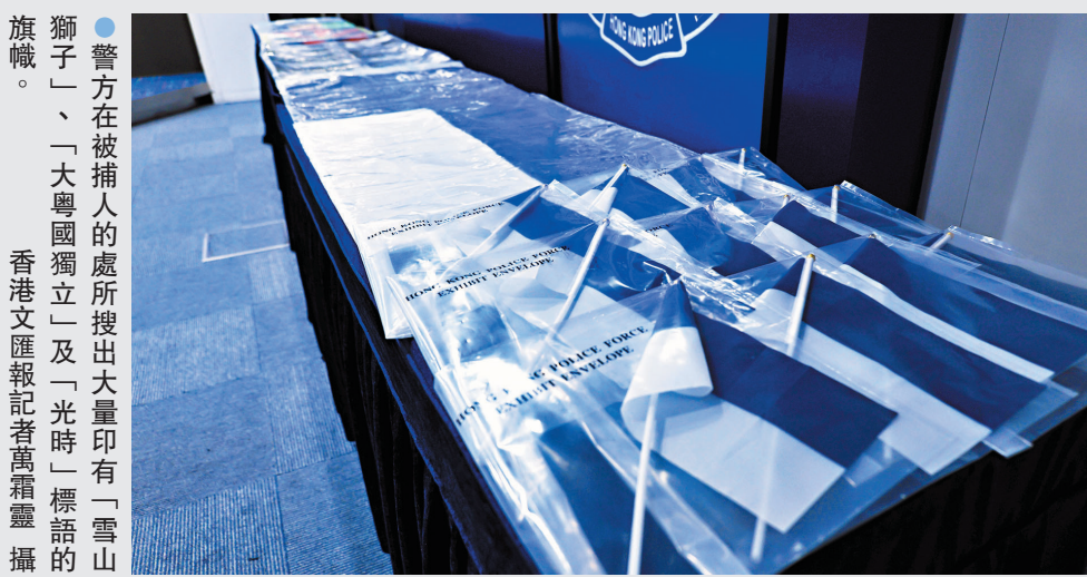
●警方在被捕人的處所搜出大量印有「雪山獅子」、「大粵國獨立」及「光時」標語的旗幟。

被捕4人中，包括該組織的秘書長、評議會會員及普通會員，分別負責設計所謂的「國旗、徽章、旗幟」，有人則專職研究如何乞求外國勢力支持，有人甚至籌辦軍事訓練。被捕人的工作主要是透過社交平台及隱密的通訊設備進行，他們會有定