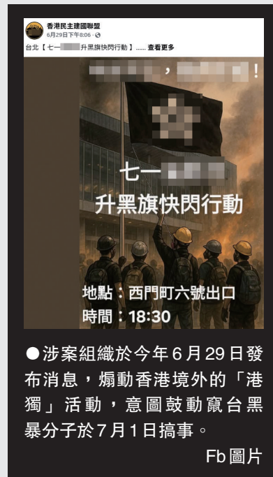
●涉案組織於今年6月29日發布消息，煽動香港境外的「港獨」活動，意圖鼓勵罷台黑暴分子於7月1日搞事。