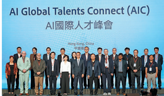
●「AI國際人才峰會」昨日在港舉辦，共同見證「香港青源會」的成立。

陳茂波在峰會上致辭時表示，人工智能正在根本性地重塑產業、經濟和社會，最終改變全球經濟競爭格局。特區政府已將人工智能列為