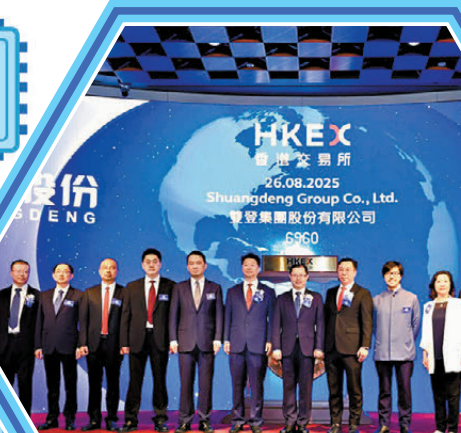
●雙登股份昨日在聯交所主板掛牌，以香港作為國際化平台計劃拓展全球業務。

Global Talents Connect (AIC) AI國際人才峰會 ●陳茂波表示，特區政府已將人工智能列為未來發展的核心產業。