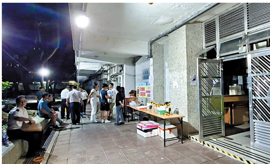
●大廈法團和管理處在地下向居民派發樽裝水和食物。