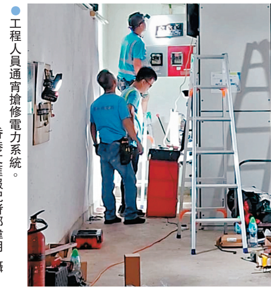
●工程人員通宵搶修電力系統。

由於天氣酷熱，停電以致住戶無法開冷氣或風扇，有居民搬櫈出走廊乘涼，表示前晚因天氣實在太熱，難以入眠，要到親友家借宿，若昨晚單位仍