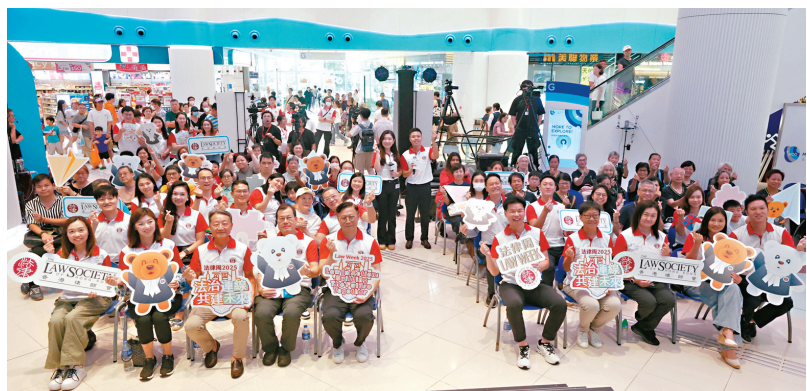
●香港律師會法律周開幕。

香港文匯報訊（記者 嚴錫華）香港律師會年度旗艦活動「法律周2025」昨日舉行開幕禮，今年法律周以「法治連線，共建未來」為主題，其中第一站位於天水圍，現場約有40名義務律師為市民提供免費的法律諮詢服務，並舉行與網購騙案相關的社區法律講座。出席開幕禮的特區政府署理律政司司長張國鈞致辭時表示，推廣法治必須深耕細作，期待與律師會及社會各界繼續緊密合作，以創意和貼地的方式，推廣及傳承法治核心價值。香港律師會會長湯文龍亦指，該會除了在水圍舉辦法律講座外，之後將到馬鞍山及深水埗舉辦法律講座，呼籲市民留意相關資訊。