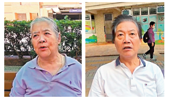
街坊羅婆婆建議獨居老人應該多出門走走，能多投放資源關注獨居老人生活。 街坊曾先生希望政府可以和其他獨居老人互幫互助。