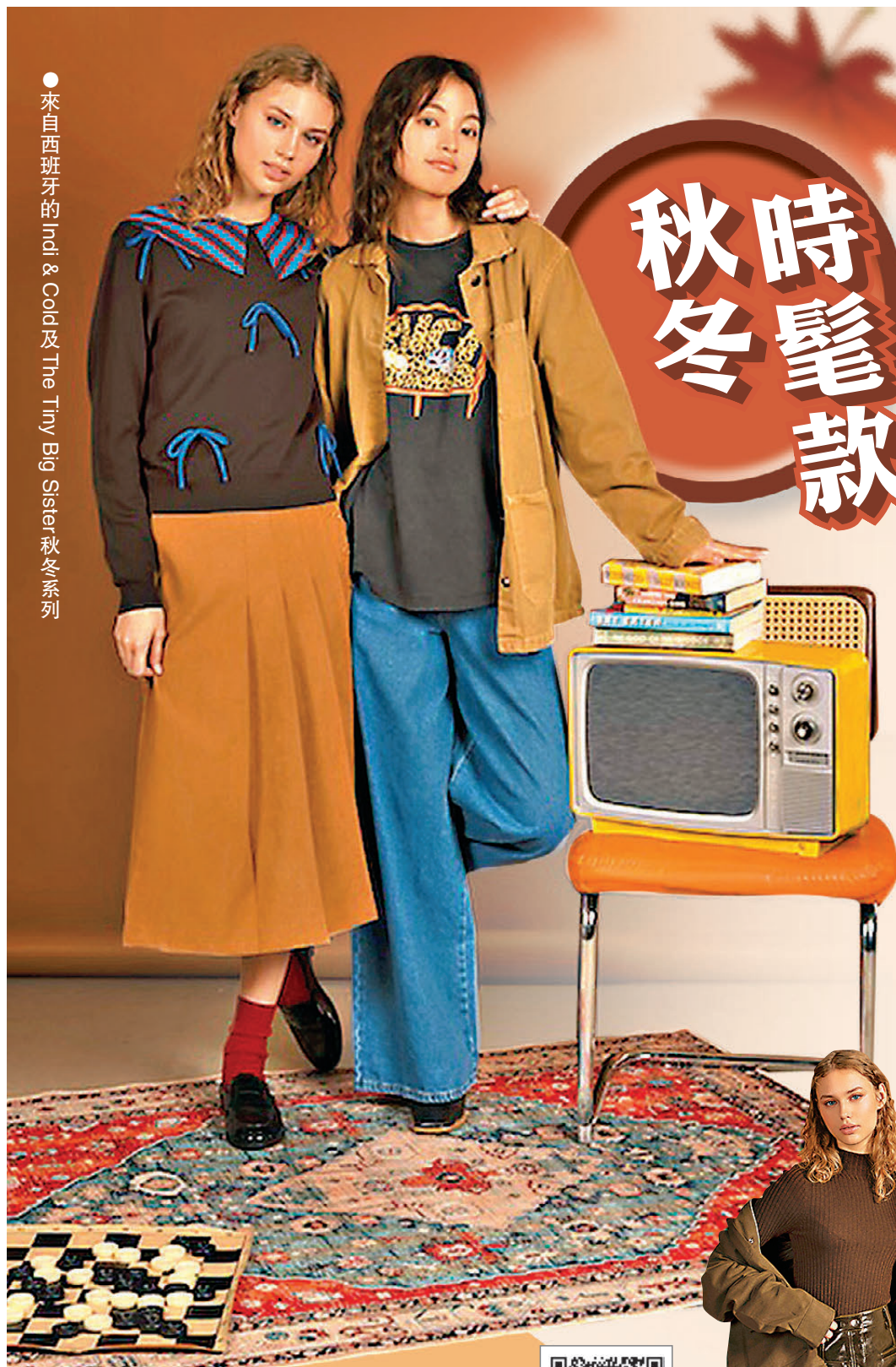
來自西班牙的Indi & Cold及The Tiny Big Sister秋冬系列

法國時尚選物店「Clémence by Rue Madame」以其獨特的巴黎時尚與鄰家親切感，並結合充滿朝氣的巴黎女子形象，演繹出既優雅又親切的風格。今個秋冬，品牌為大家精心挑選多個具潛力的新晉品牌，透過時髦款式詮釋「努力工作，盡情玩樂」的生活態度，鼓勵大家在忙碌的工作和休閒的生活中取得平衡。今年秋冬系列主打六個重點品牌，每個品牌皆具獨特風格、精湛工藝和創意，融合時尚與功能，打造多元且個性鮮明的時尚單品，成為追求前衛風格的都市女性衣櫥中不可或缺的選擇。