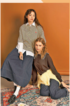
▼Bobo Choses及The Tiny Big Sister秋冬系列

另外，於韓國首爾成立的Sienna，其法語名稱意為「她的」，品牌以精緻復古風格著稱，主打高質感材質、獨特細節及流暢輪廓，打造簡約且富有女性魅力的經典造型。今年秋冬系列融合復古與現代元素，運用高質感面料與優雅剪裁，打造既時尚又舒適的服飾。設計以柔和的色調與細膩的紋理展現女性內斂的力量與自信，兼具實用性和藝術感。