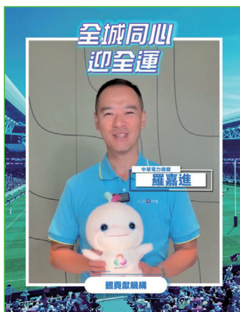
●中電總裁羅嘉進透過短片，為全運會健兒打氣。

全運會和殘特奧會進行期間，中電將繼續進行全方位支援，除了保障供電穩定，更全力推動社區參與、環保減碳、關愛社群，以及可持續發展等多方面的工作。中電期望能透過全方位的參與，為香港賽區主場注入強大動能，同時為市民帶來更多正能量，照亮每一份努力與夢想。