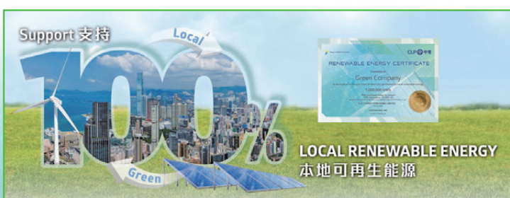
●透過贊助可再生能源證書，中電支持香港所有比賽場地及營運設施使用零碳電力，貫徹「綠色全運」理念。

為貫徹「綠色全運」理念，並支持及贊助香港賽區籌辦賽事，中電已公布將透過購買其可再生能源證書，支持全運會和殘特奧會在香港所有比賽場地及營運設施，包括主媒體中心、交通統籌指揮中心及售票中心等，使用零碳電力，以響應可持續發展的理念，同時展示中電在環境保護及企業責任方面的承諾。