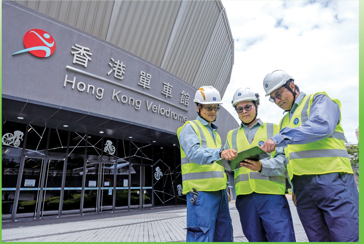
●為確保全運會香港賽區賽事順利進行，中電的工程人員檢視香港單車館的供電安排。

第十五屆全國運動會剛剛開鑼，香港會於6個場地舉辦8項競賽項目。為確保全運會香港賽區賽事順利進行，作為香港主要的電力公司，中電早已制定全面及周詳的供電安排，並配合政府各部門進行緊急應變演練，全力確保供電範圍內各個比賽場館的供電安全及穩定。除了全方位保供電外，中電亦會透過購買其可再生能源證書，支持全運會香港賽區所有比賽場地及營運設施使用零碳電力，協力打造「綠色全運」。