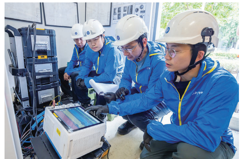
●中電電力質量小組於比賽場館進行模擬電壓驟降測試。

緊急應變方面，中電配合政府、各持份者及場館等相關單位進行不同實地演練，模擬各種可能發生的緊急事故，以進一步加強應變能力。在演練過程中，中電派出工程人員帶同臨時供電設備到場支援，