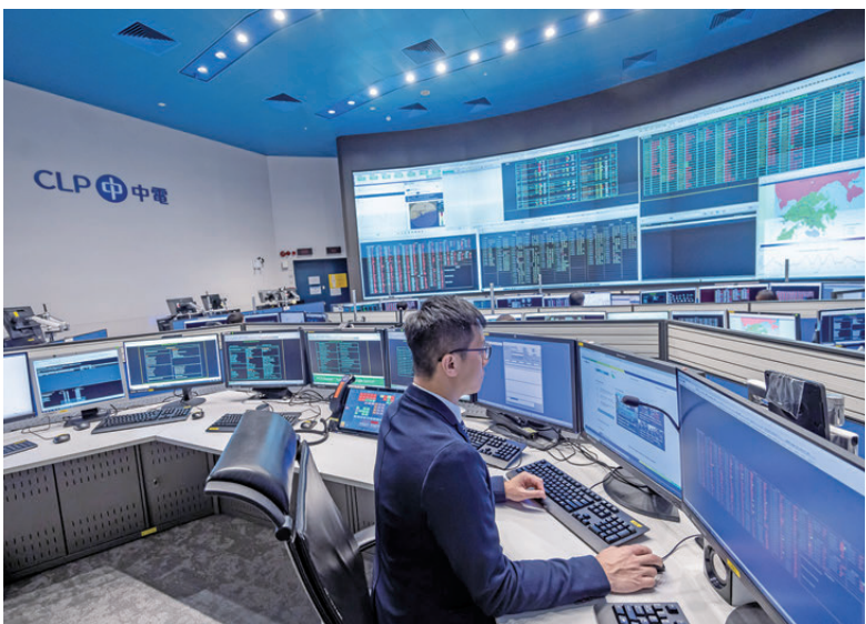
●中電系統控制中心24小時全天候運作，全力維持全運會期間的供電安全及穩定。

國家級體育盛事第十五屆全國運動會（全運會）和全國第十二屆殘疾人運動會暨第九屆特殊奧林匹克運動會（殘特奧會）於11月及12月舉行，並首次由粵港澳三地共同承辦。香港作為主場之一，過去一年已先後完成8個項目及兩項跨境賽事的測試賽，亦完成保齡球群眾項目及殘特奧會輪椅舞蹈大眾項目。