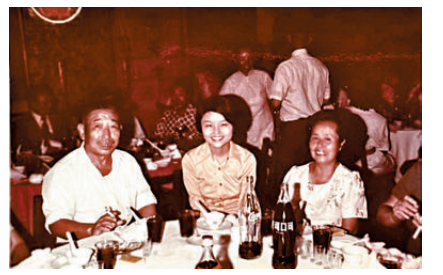
雖然我不是他們的骨肉，但一樣有舐犢親情。