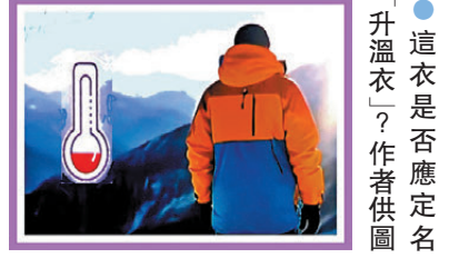
這衣是否應定名「升温衣」？