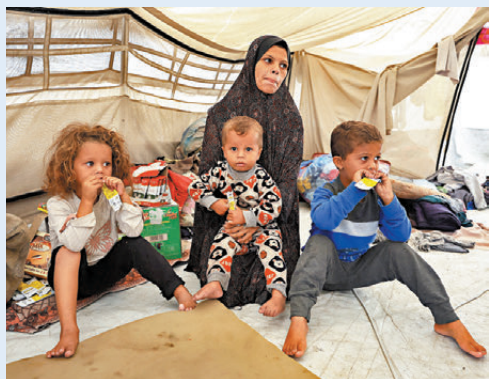
●一名巴勒斯坦婦人帶着孩子在加沙城一個帳篷裏休息。

香港文匯報訊 美國與多個阿拉伯和穆斯林國家上周五（11月14日）發表聯合聲明，呼籲聯合國安理會迅速通過一項決議案，支持美國總統特朗普的加沙和平方案。美國的最新決議，首次提出未來建立巴勒斯坦國的可能。