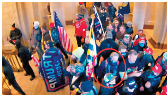
●特朗普赦免威爾遜（紅圈者）。

香港文匯報訊 美國總統特朗普近日針對2021年1月6日國會暴動相關調查案，簽署了兩項特赦，包括一名因恐嚇要對聯邦調查局（FBI）探員開槍而被定罪服刑的女子，以及一名因非法持槍罪尚在服刑的男子。美聯社報道，前總統拜登政府大規模調查國會暴動事件，至今已有逾1,500人被起訴。特朗普今次簽署的兩項特赦，是他動用總統的憲法特赦權來協助支持者的最新事例。