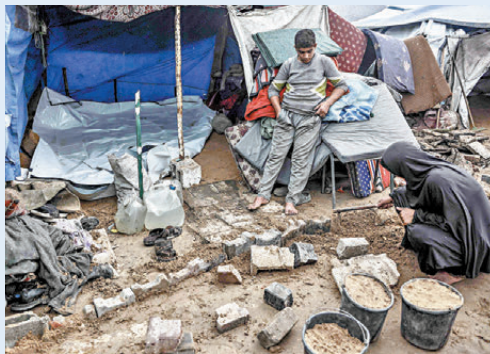
●加沙居民的帳篷營地遭淹浸。

據聯合國統計，穆瓦西營地早前已收容多達42.5萬名流離失所的巴勒斯坦人，當中絕大多數住在臨