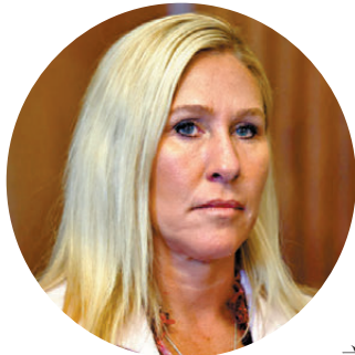
香港文匯報訊 美國全國廣播公司（NBC）報道，曾是特朗普最堅定支持者之一的佐治亞州共和黨眾議員格林（圖）上周六（11月15日）表示，在特朗普於社媒上批評她及撤回對她的支持後，她正面臨人身安全威脅。