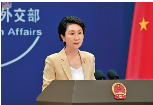
●毛寧表示，日方必須立即收回錯誤言論，給中國人民一個明確的交代。

香港文匯報訊（記者 馬靜 北京報道）日本首相高市早苗的涉台言論持續引發爭議，相關影響仍在擴大。中方密集批駁日本首相高市早苗涉台錯誤言論，有評論認為中日關係正向近年來最低點滑落。外交部發言人毛寧18日在例行記者會上就中日關係下一步走向表示，中日關係出現目前的局面，根源在於日本首相高市早苗公然發表涉台錯誤言論，粗暴干涉中國內政，嚴重違背一個中國原則和中日四個政治文件的精神，破壞中日關係的政治基礎。中方維護核心利益、捍衛國際正義的立場沒有絲毫改變。日方必須立即收回錯誤言論，深刻反省，改弦更張，給中國人民一個明確的交代。