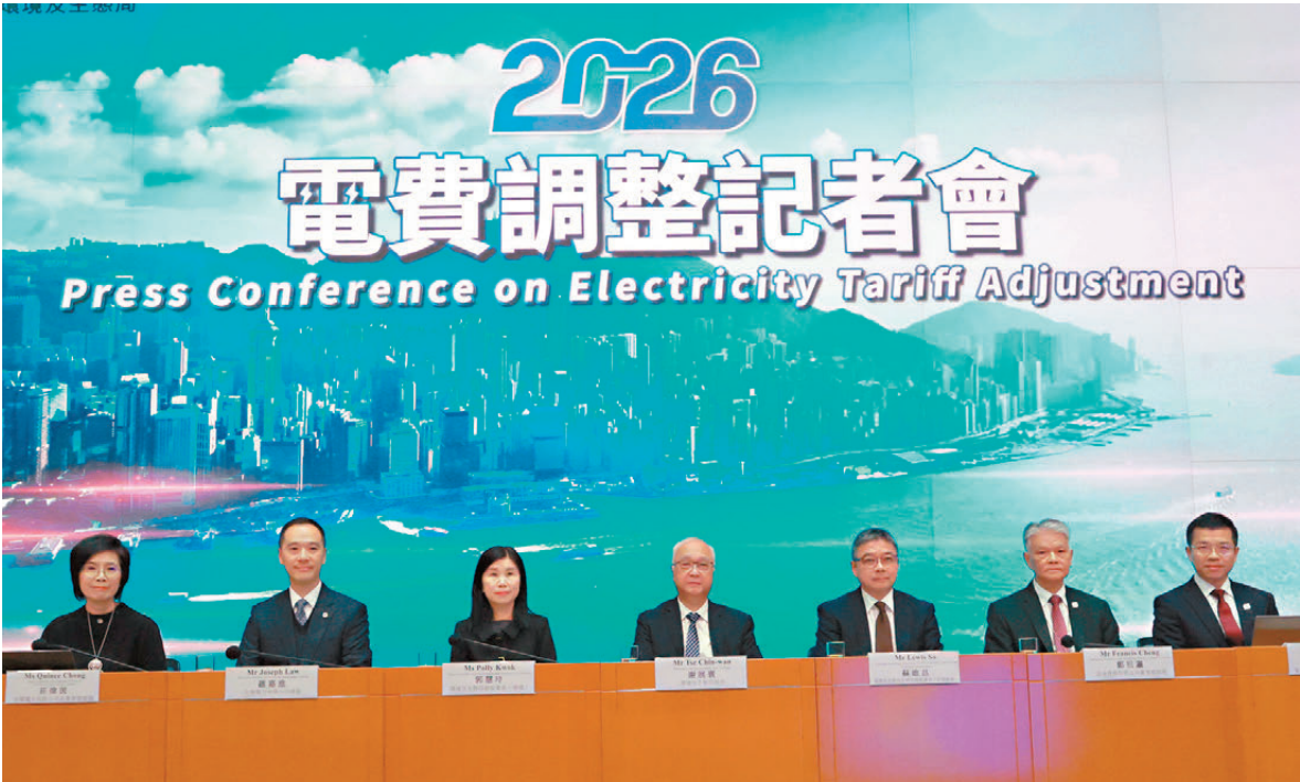
●環境及生態局與兩間電力公司昨日舉行2026年電費調整記者會。

目前電費由基本電價及燃料費組成。中電總裁羅嘉進表示，面對營運成本上升壓力，明年起平均基本電價會由每度電98仙上調3.2仙至101.2仙，但受惠於國際燃料價格緩和和平穩，燃料調整費將下調6.9仙至每度電39.4仙，平均淨電費由今年的每度電144.3仙下調至140.6仙，減幅為2.6%。 他續說，中電致力於提供安全可靠、環保且價格合理的電力服務，推動香港長遠經濟發展，深明市民對電價的關注，期望今次減價能有效紓緩市民的生活開支與中小企營運成本。雖然地緣政治仍為燃料價格帶來不確定性，但中電會繼續透過多元化的燃料組合，竭力控制燃料成本，提供可靠、環保且價格合理的電力服務。中電發言人表示，在電價調整後，約50%住宅客戶每個月的電費減幅約10元。 港燈董事總經理鄭祖瀛表示，為應對氣候變化、極端天氣等日趨增多的挑戰，並繼續致力於減少碳排放，同時需提升資訊科技系統抵禦攻擊的能力，港燈需持續更新、強化電力基建，投放必要資源提