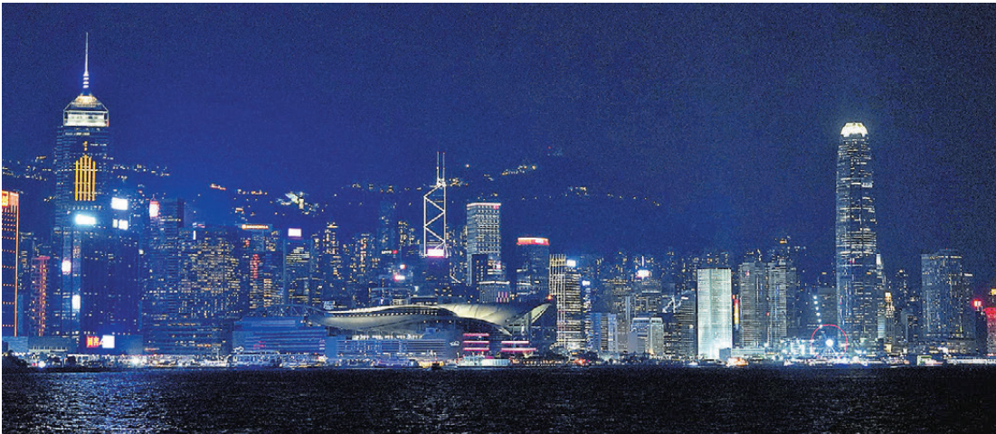
●在國際燃料價格緩和之下，香港市民明年可獲減電費。

升電力系統韌性，因此明年平均基本電費將由每度電122.9仙上調5仙至127.9仙，明年1月的燃料調整費較今年1月下調8.7仙至每度電35.4仙。港燈明年1月平均淨電費為每度電163.3仙，按年下調3.7仙，減幅為2.2%。以一個月用電量275度的住宅客戶為例，明年1月的電費將為352.1元，較今年1月的362.2元節省10.1元。