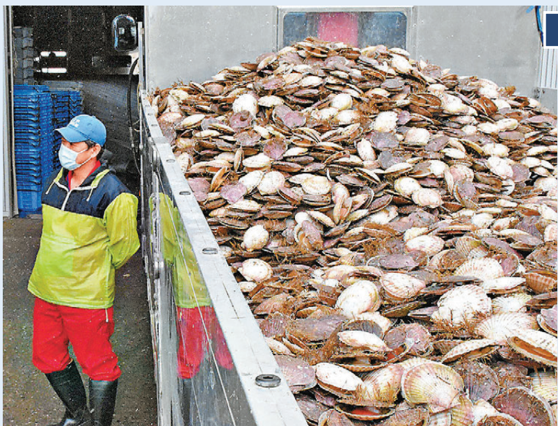
●11月上旬，中方一度恢復日本扇貝輸華。如今，中方決定暫停日本水產品進口。 資料圖片