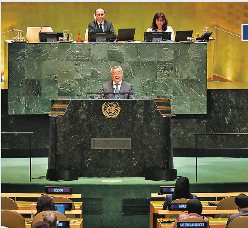
●當地時間11月18日，中國常駐聯合國代表傅聰在紐約聯合國總部第80屆聯大大會審議安理會改革問題時發言指出，日本沒有資格要求成為安理會常任理事國。