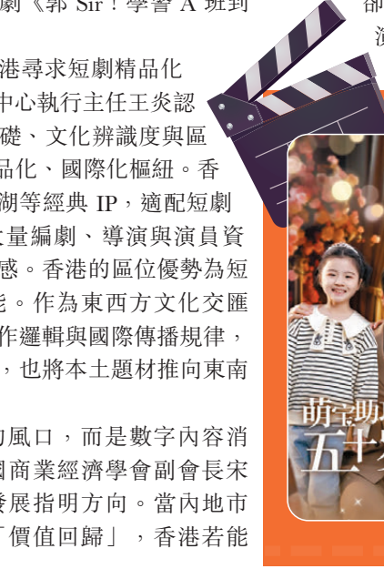
●劉曉慶主演的短劇《萌寶助攻：五十歲婚寵》。網上圖片