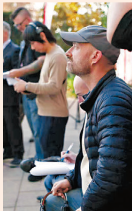
●美國導演老內在中國拍攝短劇。