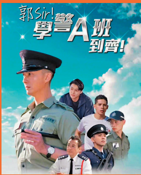
►香港警隊首部微短劇《郭Sir! 學警A班到齊!》上線。網上圖片

微短劇的異軍突起，絕非偶然。2022年傳統影視深陷低谷，聚美集團董事長陳歐已嗅到風口：「直播賽道紅海已成，短劇就是下一個現金流窪地。」疫情後碎片化解壓需求井噴，疊加短視頻平台「3秒留客」算法倒逼，單集1至10分鐘、強衝突、付費解鎖的短劇迅速化身「印鈔機」——20萬元成本半月分賬超500萬元的案例屢見不鮮，鄭州今年前八個月市場規模達38.5億元，同比增幅35.7%。 熱錢湧入催生產業鏈全線沸騰。鄭州聚美空港基地拍攝場景需提前一周搶訂，剪輯師月薪從6,000元飆升至1.2萬元仍「一工難求」；河南中牟鯢鵬小鎮滯銷樓盤改造為拍攝基地後，不僅成功回本，更帶旺周邊餐飲，15元一份的劇組盒飯日銷數千份。中國網絡視聽協會數據顯示，2024年微短劇直接及間接帶動64.7萬個就業崗位，「日結助理」等新職業應運而生，這些專職侍候演員、包攬雜務的從業者月薪200至400元仍供不應求，勾勒出行業最鮮活的煙火氣。 賽道的含金量，吸引巨頭與名家紛至沓來。今年9月，小米上線獨立短劇App「圍觀短劇」，以「無廣告」「免費看」為賣點，上線不足一個月下載量突破90萬，雷軍不僅為自製劇《時空合夥人》親錄旁白，更促成高管團隊客串。字節跳動旗下「紅果短劇」6月活躍用戶達2.1億，首度超越優酷；騰訊依託微信小程序與閱文IP庫構建內容