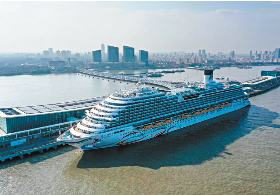
●中國旅遊集團牽頭組建央企郵輪運營平台公司，此次專業化整合後，船隊規模位居亞洲第一。圖為早前，「愛達·魔都號」停靠在上海吳淞口國際郵輪港。

據國務院國資委網站，21日舉行的會議指出，各央企高度重視專業化整合工作，圍繞服務國家戰略、推動科技創新、促進高質量發展，持續調整存量、優化增量。通過一系列整合，進一步優化產業布局，提高資源配置效率，提升企業核心競爭力。8組17家單位分兩批進行了重點項目集中簽約，此次簽約的專業化整合項目，既聚焦加快核心技術突破、壯大戰略性新興產業；又圍繞優化提升傳統產業，促進重點產業鏈高質量發展。同時，還聚焦主責主業推動專業化整合，優化資源配置，加強聯合布局新賽道。國務院國資委相關負責人強調，開展專業化整合必須符合行業和技術未來發展趨勢，堅持長期主義、堅決杜絕片面追求短期規模而搞無關多元、無序擴張。整合要錨定「高端」發力，推進同類業務整合是重點任務，消除低水平重複建設，提升效率效能。