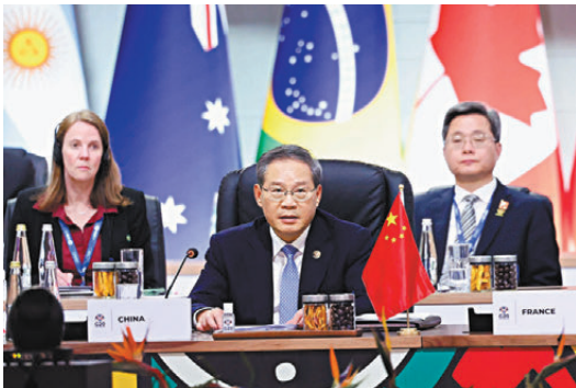
●當地時間11月22日，國務院總理李強在約翰內斯堡出席二十國集團領導人第二十次峰會第一階段會議，就「包容和可持續經濟增長」議題發表講話。

中方發布了「落實《二十國集團支持非洲和最不發達國家工業化倡議》中國行動」，支持減緩發展中國家債務，同南非共同提出《支持非洲現代化合作倡議》，還將設立全球發展學院，推動各國共同發展。 與會領導人表示，過去20多年，二十國集團成為國際社會共迎挑戰、共享機遇、共謀發展的重要平台。當今世界面臨多重挑戰，不穩定性不確定性持續上升。作為世界主要經濟體和新興市場的代表，二十國集團成員應切實擔起責任，加強團結協作，捍衛多邊主義，合力應對挑戰，維護以世貿組織為核心的多邊貿易體制，促進全球經濟治理體系改革，彌合各國發展鴻溝，推動實現強勁、平衡、包容的可持續增長。