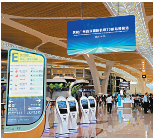
●10月30日，廣州白雲國際機場T3航站樓正式投運。網上圖片

的時間也將控制在30分鐘以內，為灣區居民提供更加便捷高效的出行選擇。 同時，機場第二高速南段與北段對接後，進一步把白雲機場的輻射力延伸至清遠、韶關等城市；向南則連接廣深高速、廣州環城高速，串聯起5條高快速路及5條國省道，進一步構建完善的粵港澳大灣區「一小時」交通圈，加速區域資源要素流動，助力大灣區「硬聯通」再升級。據悉，目前廣深高速主線擴建工程正