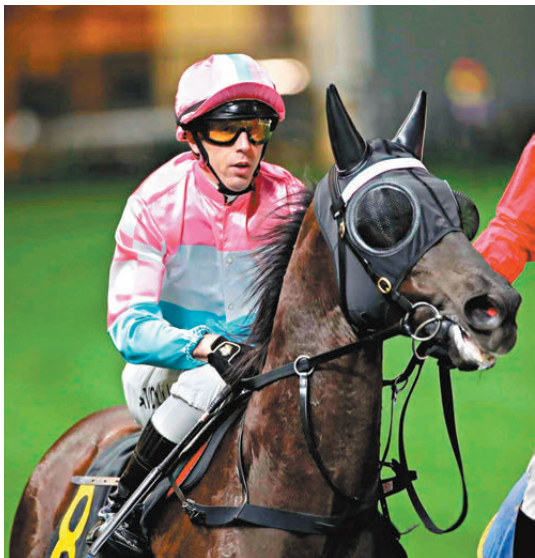
●艾道拿上季替廖康銘馬房「有你有我」贏馬。

至於牠今場最大對手相信是告東尼的「加州勇勝」，加州系今季連番播失，先是「加州本事」止於接近，繼而「加州星馳」在上周以短距離飲恨，大馬主當然希