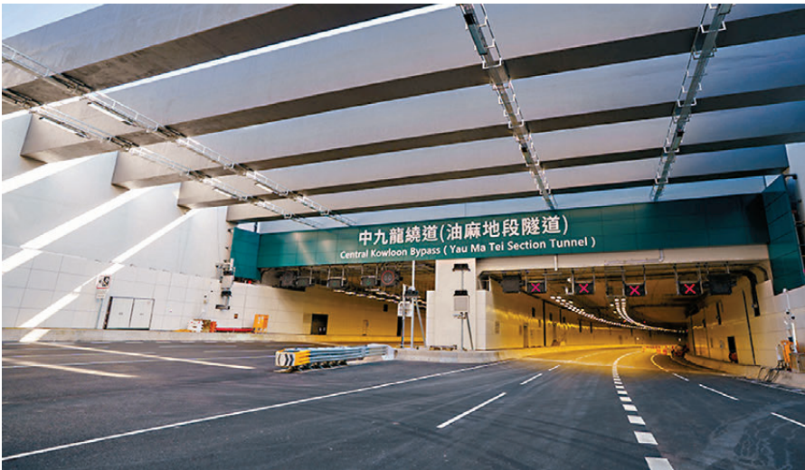
●中九龍繞道（油麻地段）下月21日通車。

現時路政署及承建商正進行最後階段工作，包括系統最後測試及相關演練工作，路政署並正與不同部門及機構為開通