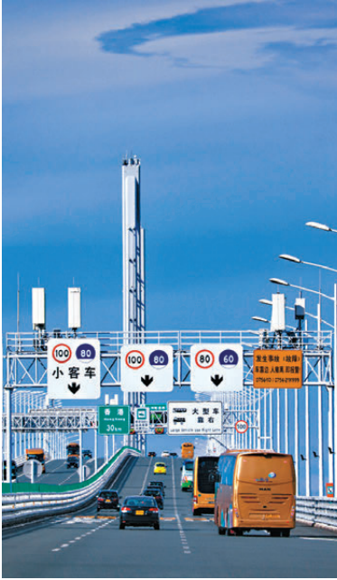
●「粵車南下」入境市區下月23日起實施。

署方又提醒駕駛者，必須遵守香港的交通法規，違者法辦，可能會被罰款甚至監禁，同時呼籲司機下載「香港出行易」應用程式，預先計劃路線，安全駕駛。