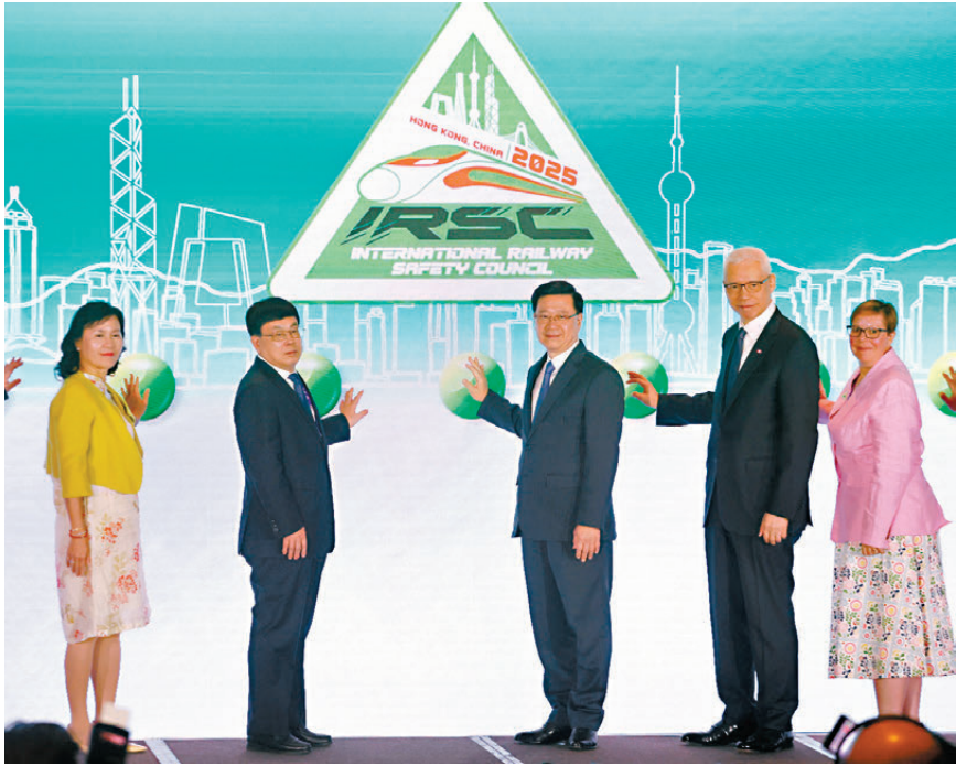
●李家超（右三）及王啟銘（左二）等主持國際鐵路安全理事會年度會議開幕禮。

第三十五屆「國際鐵路安全理事會年度會議（IRSC）」昨日起一連6天在香港舉行。今屆會議主題為「通過創新與合作促進鐵路安全」，包括為期4天的場地會議以及2天技術考察，吸引逾300個國家及地區超過300位鐵路專家、鐵路監管機構代表、營運商及行業領袖，共同探討全球鐵路安全議題。香港特區行政長官李家超在會上致辭時表示，粵港澳大灣區是香港未來發展的重中之重，促進香港與內地的深度融合，隨着兩條跨境鐵路工程陸續竣工，將進一步促進大灣區的互联互通，期望10年內實現兩地地鐵網絡的無縫對接。國家鐵路局副局長王啟銘也表示，中國積極參與全球鐵路事業，推動基礎設施「硬聯通」，與規則標準「軟聯通」協同發展。