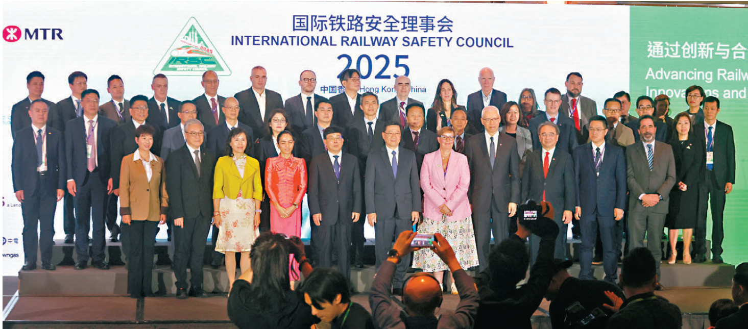
●國際鐵路安全理事會年度會議昨日開幕，李家超及王啟銘等與會者在台上合照。