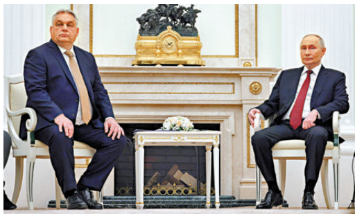
● 歐爾班(左)上月訪俄與普京會面。 資料圖片

波蘭網絡傳媒Do Rzeczy也質疑，即使波匈雙方在對俄問題上取態不一，波蘭當局也沒有必要取消領導人會晤，「波蘭不應隨意與傳統盟友交惡，更不應全面決裂。」