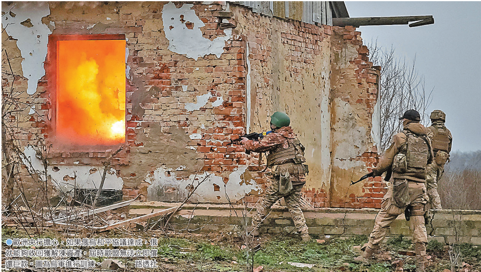
● 歐洲央行擔心，如果俄烏和平協議達成，俄就能夠收回獲解凍資產，屆時歐盟無法立即償還巨款。圖為烏軍進行訓練。