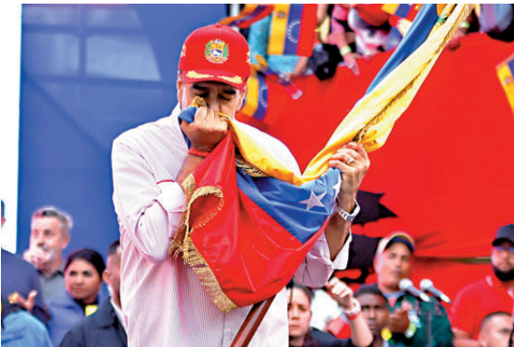
● 馬杜羅在集會上親吻國旗。

特朗普政府持續數月增兵加勒比海地區，集結火力規模遠超打擊販毒行動所需，美軍自今年9月以來，已在加勒比海和太平洋地區襲擊所謂販毒船隻超過20次，造成至少83人死亡，以此持續向委施壓。委內瑞拉當局警告，美國此舉顯然意在推翻委政權，以控制該國包括石油在內的豐富自然資源。