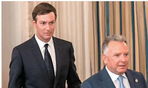
● 威特科夫(右)與特朗普女婿庫什納周二抵達俄羅斯首都莫斯科。 網上圖片

方會努力為尋求購買俄產石油的買家創造有利環境。普京將在周四訪問印度，尋求恢復俄羅斯與印度在國防和能源領域聯繫。