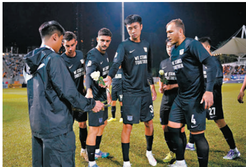
▲球員在比賽前獻花。

能做善事，這正是現時香港需要的東西。」 雖然昨仗於晚上8時舉行，但在開賽前兩小時已有大批球迷排隊購買紀念品及等候入場，此場景令楊先生感受到團結的力量，「今次安排很好，會方職員能清楚告訴我善款會捐去哪裏，令到我可以幫助到想幫的人，大家都略盡綿力去幫助受影響的人。」 此外，足總亦響應球會自發的籌款行動（包括捐出球場門票收益及義賣等），將傑志對東區及北區對大埔兩場賽事屬於足總的門票收益全數捐出。楊先生認為這就是一方有難八方支援的例子。 另外，傑志昨晚身穿全黑球衣應戰，兩隊賽前獻上鮮花，並與現場觀眾在開賽前默哀一分鐘，最終傑志以1：0擊敗東區。