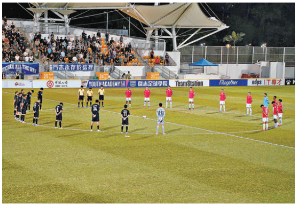
●賽前兩隊進行默哀儀式。