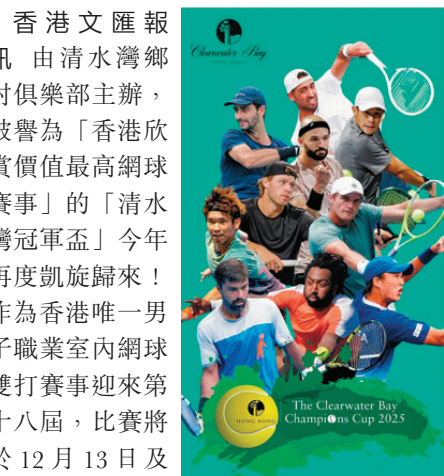
●清水灣冠軍盃雲集世界頂尖雙打球手。 公關圖片

香港文匯報訊 由清水灣鄉村俱樂部主辦，被譽為「香港欣賞價值最高網球賽事」的「清水灣冠軍盃」今年再度凱旋歸來！作為香港唯一男子職業室內網球雙打賽事迎來第十八屆，比賽將於12月13日及14日假清水灣鄉村俱樂部展開為期兩天的網球盛宴。 今年比賽陣容強勁，邀請了10位來自美國、澳洲、荷蘭、韓國、中國台灣及印度的球手，大部分選手更是世界排名前100的雙打好手，包括美國選手Evan King（排名第16）及荷蘭球手David Pel（排名第29）等。務求為球迷帶來頂級的觀賽體驗，並推廣本港網球運動發展，吸引更多年輕人參與。