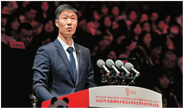
●中國乒協主席王勵勤在國際乒聯混合團體世界盃開幕式上致辭。

香港文匯報訊 據新華社報道，2025國際乒聯混合團體世界盃正在成都進行，中國乒協主席王勵勤周一（1日）接受採訪時表示，中國隊將把今次世界盃視作「奧運預演」，積極做好2028年洛杉磯奧運會的備戰工作。 乒乓球混合團體項目被納入2028年洛杉磯奧運會，令今次世界盃的「含金量」大幅上升。談及備戰計劃，王勵勤指出，首先要強化系統研究，深入研究賽制規律，制訂完善的備戰策略和科學的訓練計劃；其次要優化團隊配置，根據比賽中運動員和教練員的臨場表現，以及團隊的運行情況，精心打磨多種團隊組合；同時要加強協同配合，按參賽需要明確團隊內部的人員分工，全力為運動員及教練做好