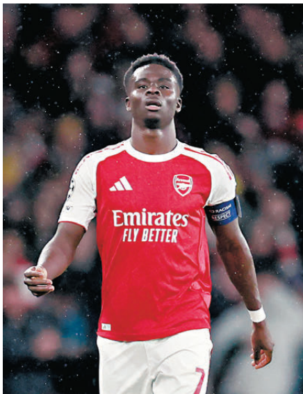
●為保持榜首地位，阿仙奴今仗志在必得。 資料圖片

英超第八位的利物浦，將在周四迎戰第六位的新特蘭。衛冕冠軍利物浦近期成績低迷，主帥史洛在上場作客韋斯咸首次把近期啞火的射手穆罕默德沙拿列為後備，以德國中場域斯頂替，成功解放球隊創造力；瑞典前鋒阿歷山大伊沙克亦終於在上輪英超開齋，助紅軍以2：0擊敗韋斯咸，終止各項賽事三連敗頹勢。新特蘭主力後衛丹尼爾保拉特及中場埃文斯出戰成疑，防線再遭考驗，紅軍誓必主場乘虛而入。（Now621、611台周四凌晨4:15a.m.直播）