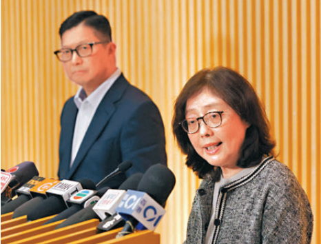
●鄧炳強（左）及甯漢豪（右）昨日會見傳媒，交代炮台山富澤花園及柴灣峰華邨棚網報告懷疑造假。

倘化驗報告顯示棚網不符標準，政府會追究到底，按《建築物條例》和其他刑事相關的條例跟進處理。