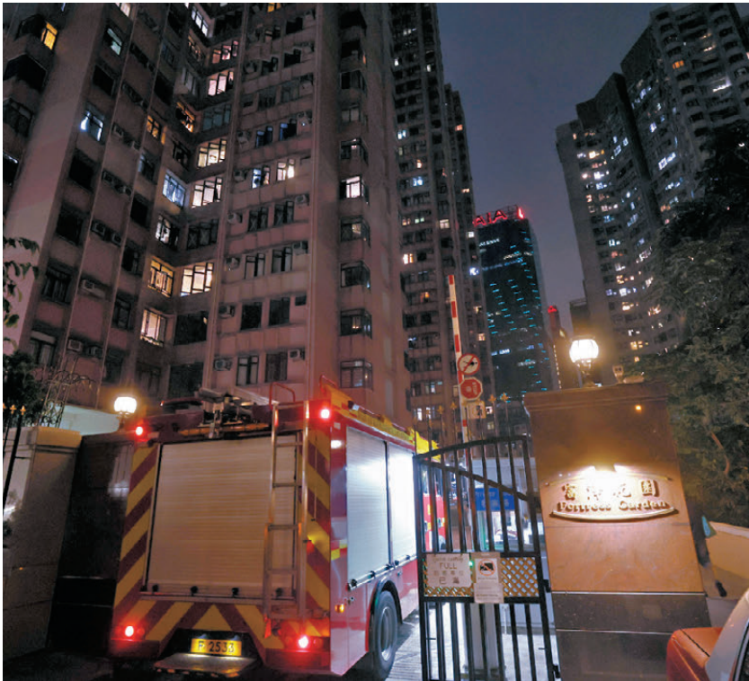
●被揭發棚網檢測報告懷疑造假的炮台山富澤花園，昨日已拆除棚架及棚網。