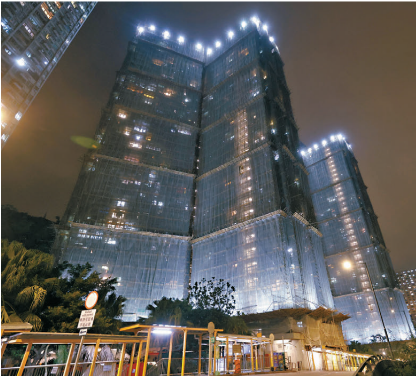
●被揭發棚網檢測報告懷疑造假的柴灣峰華邨，樓宇昨晚仍被竹棚及棚網包裹。 香港文匯報記者曾興偉 攝

鄧炳強昨晚會見傳媒，指出峰華邨和富澤花園兩個屋苑的棚網阻燃檢測報告懷疑造假，有人宣稱棚網由「山東宸旭化纖繩網有限公司」生產，分別獲得「國家勞動保護用品質量監督檢驗中心」或「濱州市檢驗檢測中心」發出的阻燃合格檢測報告。