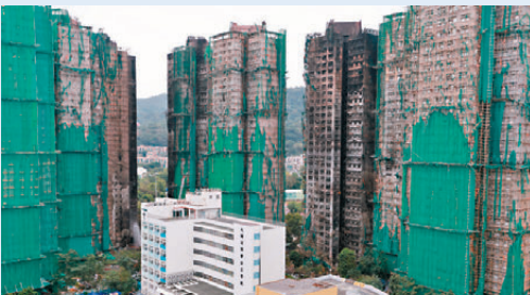
●中銀保險完成宏福苑38宗家居保險30%受保金額的臨時先行賠付。

香港文匯報訊（記者 鄭治祖、周曉菁）中銀集團保險微信號公布，為全力支持香港大埔宏福苑重大火災事故救援，中銀集團保險在事發後第一時間開設服務專線和應急理賠綠色通道，簡化理賠手續，推出豁免申索期、「先行給付、全額賠付」、豁免續保費等系列優先保障措施。 簡化手續「先行給付、全額賠付」 保監局主席姚建華昨日出席亞洲保險科技洞察高