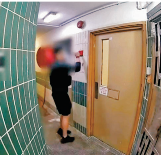
●身穿黑衫男子用硬物敲打火警鐘，但火警卻沒有響。網上圖片

迅速瀰漫整條走廊，火勢不可收拾。 疑向消防處訛稱工程時不關警鐘 另一條在網上流傳、疑由宏建閣某單位門外閉路電視於火警當日下午3時28分拍攝的片段顯示，一名身穿黑色衫的男子用硬物敲打火警鐘，但火警鐘仍沒有響，其後一名中年女居民表示：「冇冇滅火筒？喇度燒得好緊要。」據悉當時消防已將火警升為三級。 警務處處長周一鳴昨日交代火災的最新調查進展，證實繼日前以涉嫌謀殺罪名拘捕15人外，另外拘捕多6人（44歲至55歲），他們是消防裝置承辦商，涉嫌向消防處作出虛假陳述，訛稱工程期間不會關上消防警鐘，目前其中一人已獲准保釋候查，其餘5人仍被扣查。案件累計已有21名工程相關人等被捕，當中11人同時被廉政公署拘捕，案件仍在調查中。 警方完成7幢樓宇內部搜索 周一鳴表示，截至昨日火災已造成159人死亡，當中140具遺體包括49男91女，初步