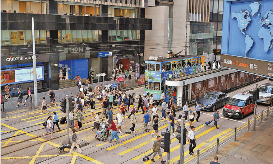
●香港營商環境持續好轉，擴張速度也是逾兩年半以來最快。

標普數據還指，需求升溫下，生產的擴張速度攀至2023年4月以來最快。隨着業務經營和採購比上月增長，用於前期生產的採購庫存連續六個月上升。受訪業者表示，企業積極採購、儲備庫存，藉以配合