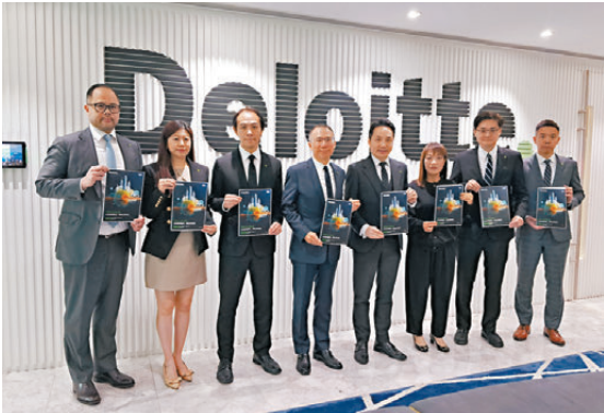
●德勤昨於香港正式啟動「德勤出海專班」，為內地企業提供一站式專業服務，助其拓展全球市場。

對於內地企業借香港平台「出海」，曾順福指，內地企業直接出海包含不少隱藏成本，而香港有政策協助他們減省成本，亦有措施保護他們持有的知識產權。德勤香港稅務與商