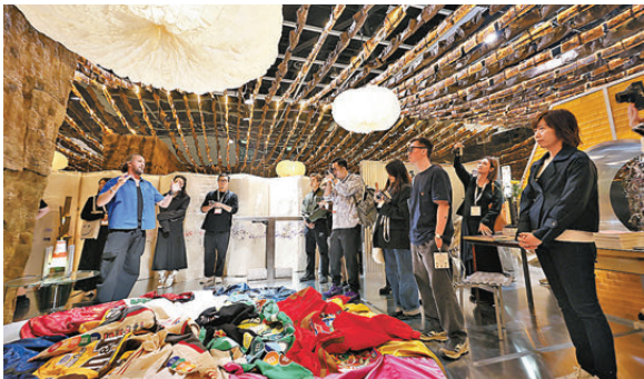
●「DesignInspire 創意設計博覽2025」昨日揭幕。

此外，亞洲知識產權商會論壇、創業日、創業快綫：國際篇 2025 等三項重點活動，亦會於今明兩日假香港會展中心舉行，為業界締造更多商機。與會者亦可透過活動提供的一對一商貿配對服務，與各地的設計服務公司及創新企業進行精準對接，探討合作機會。