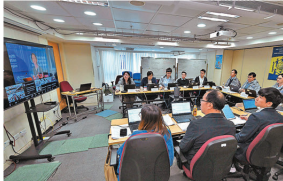
●衛生署聯同食物環境衛生署及漁農自然護理署參與世界衛生組織桌面演習。

世衛西太平洋區域辦事處自2008年起，每年舉辦水晶演習，協助成員國和地區預防及應對跨地域及影響世界各地人口的公共衛生風險，同時與各地負責執行《國際衛生條例》的聯絡單位保持緊密溝通，確保各地區熟習應對公共衛生突發事件的機制。