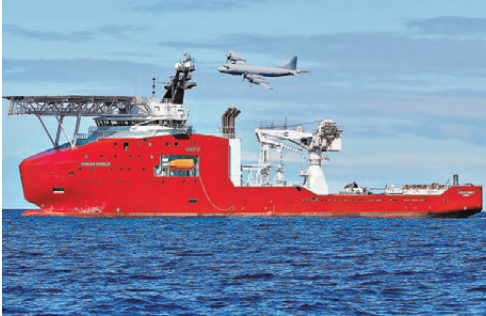
●MH370多年搜索行動無果。 資料圖片

資料顯示，相較於2018年的搜尋，是次搜尋任務將在範圍精確性、艦隊規模及技術方面均顯著提升，探索MH370的區域已大幅縮減至原先範圍的13.4%，包括此前從未涉足的潛在地帶。