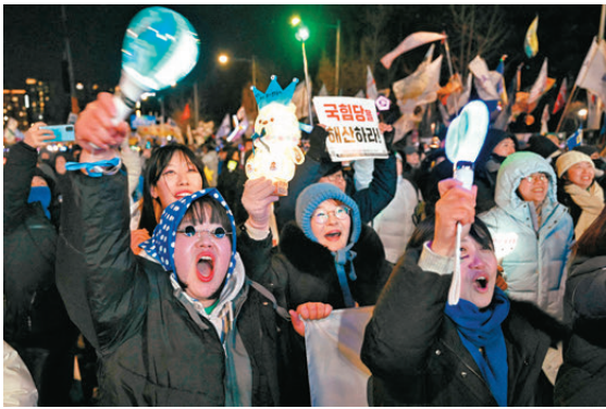
●首爾民眾在戒嚴鬧劇一周年集會抗議。

朗普建議在美國費城造船廠建造核潛艇，不過李在明指出，這在現實上比較困難，在韓國建造核潛艇於經濟、軍事層面都較為理想。