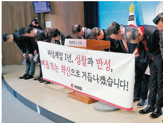
●國民力量黨議員鞠躬道歉。

香港文匯報訊 距離韓國前總統尹錫悅發布緊急戒嚴已過一年，當時執政國民力量黨的現任黨魁張東赫拒絕為此事道歉，不過黨內有多名議員周三(12月3日)各自發聲明或開記者會道歉。