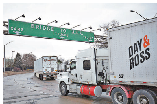
●美國認為與加拿大的經濟關係，和美墨經濟關係截然不同。 資料圖片

報道指出，威脅撕毀或退出現有協定，是特朗普慣用的談判策略。在促成USMCA協定時，特朗普也曾威脅會撕毀北美自由貿易協定。