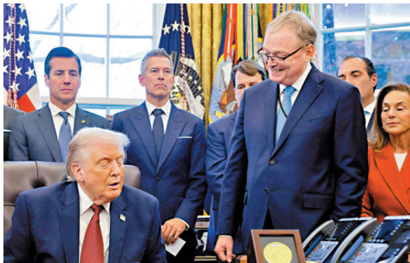
●白宮高級經濟顧問哈塞特(前排右)深受特朗普信任。

澳洲的社媒禁令實施情況受全球關注，包括馬來西亞、新西蘭、德國和丹麥等國家都考慮推出類似措施。