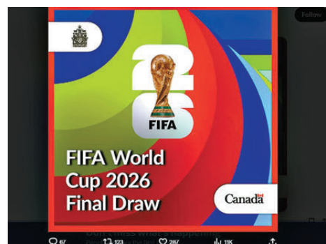
●加拿大重視主辦世界盃，成小智、攝政官網追貼進展。

同一項民調顯示，52%的受訪者表示如果得到兩張世界盃門票，他們會嘗試出售換取現金。很多人表示加拿大首次主辦世界盃賽事值得興奮，但足球在國內的受歡迎程度不及棒球和冰球，球迷不會瘋狂追捧。