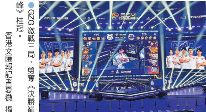
●GZG激戰三局，勇奪《決勝巔峰》桂冠。

香港文匯報訊(記者 夏微 上海報道)2025上海電競大師賽於12月3日至7日舉行，包含《決勝巔峰》、《無畏契約》、《守望先鋒》和《第五人格》四個項目的角逐。周三(3日)《決勝巔峰》率先上演揭幕戰，The MongolZ、RA、GZG、YBG四支戰隊展開精彩的四強雙敗淘汰賽，最終由GZG以2：1鎖定冠軍。 當日比賽，GZG在兩場BO1中先後擊敗RA和MGLZ，率先取得冠軍戰入場券。YBG則在敗者組賽事及敗者組決賽中，上演「一穿二」的奇跡翻盤，成功奪得另一張冠軍戰門票。終局之戰採用BO3賽制，手感火熱的YBG先贏首局。第二局GZG重整節奏，成功扳平比分。決勝局雙方均展現極致謹慎與實力。比賽至12分鐘，GZG抱團強攻高地，但面對刷新出現的領主，選擇放棄強攻，轉而收下領主。其後雙方均謹慎發育，但經濟差距已達5k，YBG逐漸陷入劣勢。到17分鐘，GZG攜領主再度衝擊YBG高地，不惜犧牲隊員，用拚命的方式強攻對方主基地。YBG雖驚險守下該波團戰，但已是強弩之末，面對GZG再次抱團強攻，終究回天乏術。最終GZG摧毀對手主基地拿下比賽，成功奪冠。