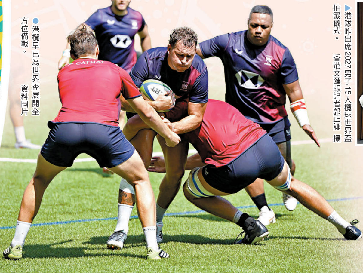
●港欖早已為世界盃展開全方位備戰。資料圖片