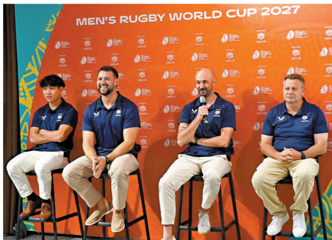
▶港隊昨出席2027男子15人欖球世界盃抽籤儀式。