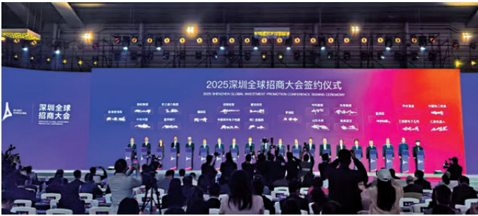
●2025深圳全球招商大會5日在深圳會展中心（福田）開幕。

據悉，是次大會引資總額超7,700億元，現場簽約項目超340個。大會現場，中電控股、富邦銀行、通力電梯、螞蟻集團等作為企業代表參與當天的重大項目簽約儀式，與前海