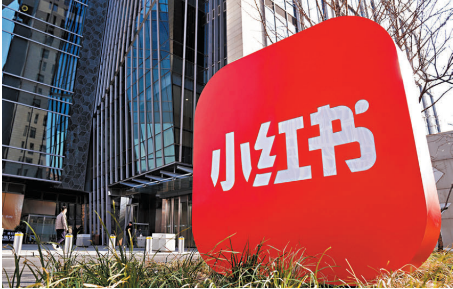
●台當局封禁小紅書「雙標」行為引發島內網友痛批。圖為12月5日拍攝的小紅書北京辦公區。

一名台灣網友5日告訴《環球時報》，「不希望小紅書被封鎖，因為自己每天都在逛。」他在一篇帖文中介紹稱，台灣有很多社交軟件，但自己日常最常用的還是小紅書。一方面，因為大陸人口眾多