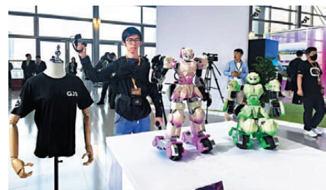
●主會場設置「招商走廊」和「品牌展示區」，呈現深圳科企魅力。