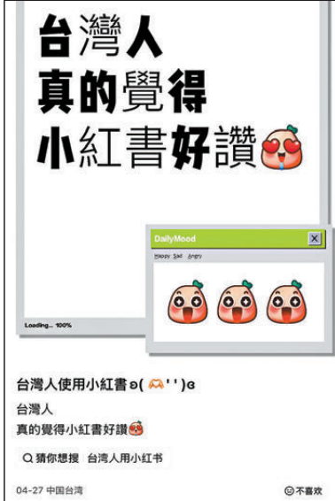
●早前，台網友發帖點讚小紅書實用（左）和12月5日台網友發帖告別小紅書（右）。