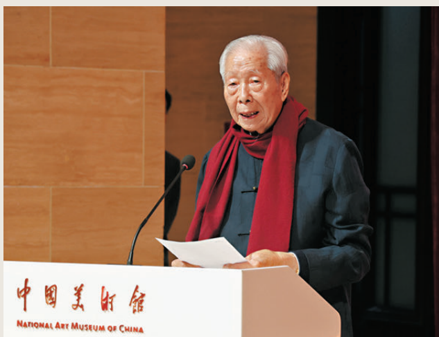
●施子清在「九十禮讚 翰墨華章——施子清博士書法展」開幕式上致辭。

「九十禮讚 翰墨華章——施子清博士書法展」昨日（5日）在中國美術館開幕。今次展覽精選香港大紫荊勳賢、中國書協香港分會主席施子清書海生涯創作的119件（組）書法精品，涵蓋楷、行、草諸體，系統展現其扎根傳統、融通古今的藝術歷程，呈現其心繫家國、情牽桑梓的人文情懷。施子清在開幕式上致辭時表示，自少年時代執筆習字至今，書法已融入生命，成為自己精神的寄託與情感的歸宿。「九十載人生路，我親歷了國家的滄桑巨變，見證了時代的蓬勃發展。」他說，「我的筆墨，既是對千年書藝傳統的追尋與叩問，亦是對個人生命體驗與時代脈搏的記錄與抒懷。」