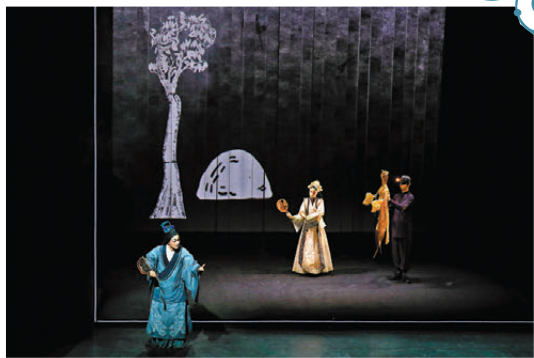
●《莊周夢蝶》劇照

變革與融合，無疑是今年藝術節眾多劇目最凸顯的藝術追求。開幕大戲《戲悟》由北京風雷京劇團打造，在跨界探索中開闢了一片戲劇新天地。演出融合京劇中「臉譜+戲台」等視覺化元素，將緝毒英雄和毒梟之間的鬥智鬥勇，與傳統戲曲橋段產生了靈魂聯動。在表現上，作品找到了戲曲元素與話劇形式的統一；在情境上，戲中主角與毒販周旋，運用了京劇《三岔口》一白一黑的搏擊；並汲取當下人們生活中的典型形象，對應成戲曲臉譜，視覺奇幻新穎。舞台上，京劇演員以無實物表演展現傳統身段，一招一式韻味十足，既彰顯了京劇藝術的獨特魅力，又推動了劇情發展，更在虛實之間揭示了人物內心的掙扎與覺醒。這種融合不是簡單的形式疊加，而是從