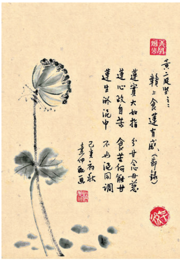
黃庭堅之二 贛上食蓮有感（節錄）