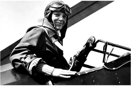
●駝峰航線上的美軍飛行員。

為解決駝峰空運飛行員經驗不足的問題，美軍從1943年7月18日開始實施「7-A項目」，作為美國對中國軍事任務的一部分。「7-A項目」要求美國航空公司派出熟練機組人員到印度，與空運聯隊的年輕機組人員一起飛越駝峰，在印度和中國之間運送物資。「7-A項