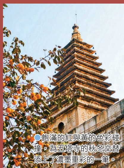
●飽滿的紅與黃的色彩碰撞，為五塔寺的秋冬交替添上了濃墨重彩的一筆。

暮色四合，爐火漸微，烤紅薯攤仍守着一方暖光，餘燼裏埋着未盡的暖。這烤紅薯的甜香，就這樣成了十二月的京城裏最溫暖的存在，以最樸素的方式，在秋冬交替的縫隙裏，為整座城市煨出一片可以握在掌心的春天。