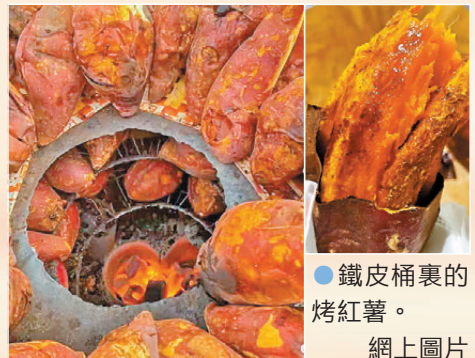
●鐵皮桶裏的烤紅薯。

每到秋冬時節，京城的街角總能看到烤紅薯攤。鐵皮桶裏的炭火燒得正旺，紅薯埋在其中，表皮被烤出薄薄焦殼，慢慢皺縮，泛出深褐色的油光，偶爾還發出「滋滋」的輕響。攤主用長鐵鉗熟練地翻動着，紅薯裂開的紋路裏滲出琥珀色的糖汁，滴在炭火上，瞬間騰起一縷帶着焦香