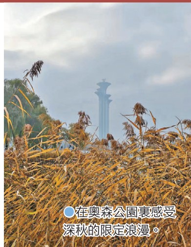
●在奧森公園裏感受深秋的限定浪漫。