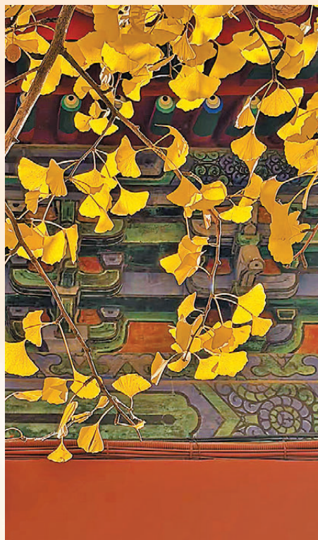
●深秋京城民眾偏愛小眾景色。

京城的十二月，是一段被忽略的「黃金過渡期」。它以一种克制而深情的姿態，將秋的豐盈與冬的素淨悄然縫合，短暫卻珍貴。它不似春天那般嬌柔，不如夏天那般熱烈，也不像冬天那般凜冽，它帶着恰到好處的溫暖與涼爽，帶着五彩斑斕的色彩，帶着豐收的喜悅，更帶着人與人之間的溫情。這個時候，若你厭倦了人潮湧動的「頂流」景點，不妨找個周末，看古塔映霜，聽蘆葦低語，在紅牆與初雪之間，把日子過成一首靜謐而溫暖的詩。這種轉向，不是逃避熱鬧，而是對生活節奏的主動調整，是對季節本真的尊重與熱愛。