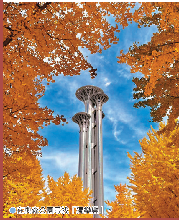
●在奧森公園尋找「獨樂樂」。

十二月的奧森，藏着最鮮活的生活氣息，美在不刻意雕琢。沒有專門打造的打卡裝置，只有自然生長的草木與蜿蜒的步道，卻展現出最本真的自然之美。健身的市民慢跑而過，孩子們在草坪上嬉鬧，老人坐在長椅上曬太陽，一切都顯得從容自在。這裏沒有網紅打卡的擁擠，只有人與自然的和諧共處，秋的溫柔與冬的清冽在此碰撞，讓每個前來的人都能找到屬於自己的閒情逸致。深吸一口清冽的空氣，滿是草木與泥土的芬芳，驅散了城市的喧囂，只剩內心的平靜與舒暢。