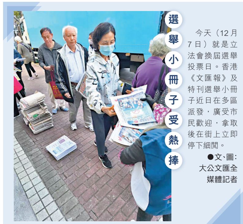
選舉小冊子受熱捧

今天（12月7日）就是立法會換屆選舉投票日。香港《文匯報》及特刊選舉小冊子近日在多區派發，廣受市民歡迎，拿取後在街上立即停下細閱。