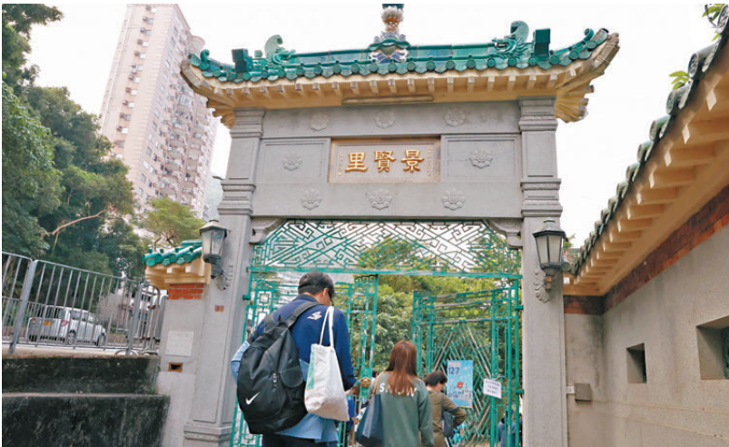
▲景賢里、太空館等景點一連兩天免費開放。

第八屆立法會換屆選舉今日如期舉行投票，特區政府因應大埔宏福苑火災，取消「選舉繽紛日」活動，但保留多項優惠措施，包括昨日及今日向市民免費開放文娛設施。香港文匯報記者昨日走訪香港太空館、香港藝術館以及法定古蹟景賢里，現場有不少市民一家大小到場參觀，當中不少市民均表示今日將會履行公民責任，為立法會選舉投下一票，希望為香港的建設出一分力。 ●香港文匯報記者 李芷珊、鍾靜雯、洪澤楷