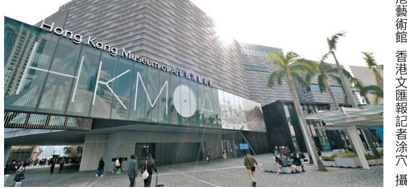
●香港藝術館