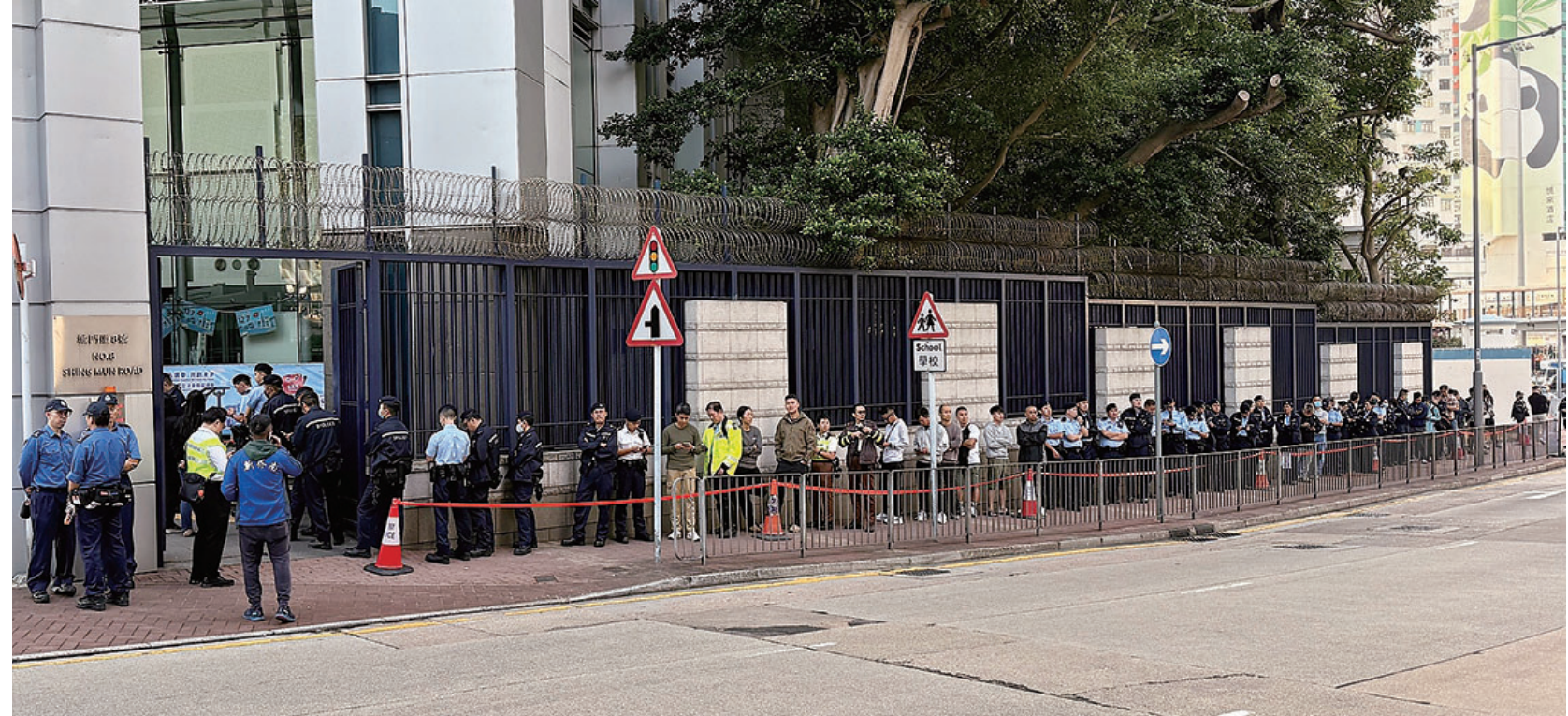
●荃灣公務員專屬投票站香港警務處新界南總區總部專屬投票站，準備投票的公務員一度排起長龍。

克難前行 推動改革 文平理 一場突如其來的火災，給香港留下了深重創傷；一場如期舉行的選舉，為香港注入了前行力量。就在昨天，香港社會以非凡的韌性與團結，圓滿完成了第八屆立法會選舉。這是一場歷經特殊淬煉的高質量民主實踐，其意義尤為重大，其影響尤為深遠。 有力彰顯新選制先進優勢 此次選舉從一開始就展現符合香港實際高質量民主的新氣象。部分資深議員主動表示不再參選連任，為更多新人提供機會，這種有序更替彰顯了民主真諦，體現出新選制的開放性。競選過程一掃曾經的喧囂與對立，早現出風清氣正的「君子之爭」。候選人以政綱論高低、以能力決勝負，以表現爭認可，讓選舉回歸為民服務本質，印證了新選制的初衷。而在大埔火災事故發生後，選舉競爭更昇華為一場無私奉獻的比賽。許多候選人脫下競選背心，換上義工服裝，將競選辦公室改為救災物資收集站，通宵堅守庇護中心為災民嘘寒問暖，以實際行動詮釋了服務市民、服務社會的摯誠。 有力展現特區政府責任擔當和能力 作為「當家人」、「第一責任人」，李家超行政長官和特區政府周密部署、積極作為，為確保立法會選舉公平、公正、公開、安全、有序舉行，做了大量深入細緻工作。面對突如其來的災難，行政長官親自指揮，政府部門全面動員，全力以赴，高效專業開展救援和善後工作，展現出強大組織力、凝聚力與戰鬥力；得到社會各界的充分肯定。特區政府統籌救災與選舉，如期成功舉行這場涉及數百萬選民的選舉，其擔當和能力進一步增添香港社會克難前行的信心與底氣。 有力凝聚社會各界同心同德奮鬥 在此次選舉中，社會各界以前所未有的主人翁精神，積極響應政府號召，全面展開選舉動員，形成熱烈選舉氛圍。大家深明，只有「真心投一票」才是「真正愛香港」，都行動起來參與投票，才能夠選出堅定愛國愛港、有能