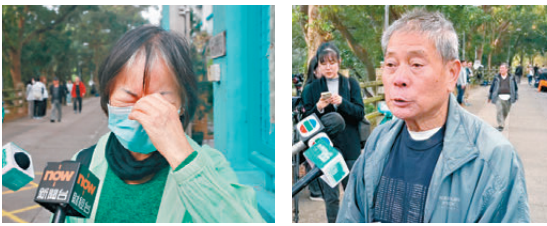
●宏福苑選民感觸落淚。 ●宏福苑災民黃先生

到一個好地方，安穩地住下來。」在宏盛閣居住了43年的陳先生表示，火災對生活影響很大，但作為香港市民，仍要盡公民責任去投票。他肯定政府救災表現，「各種支援方面都挺到位的」，盼望新一屆立法會繼續實實在在服務市民。