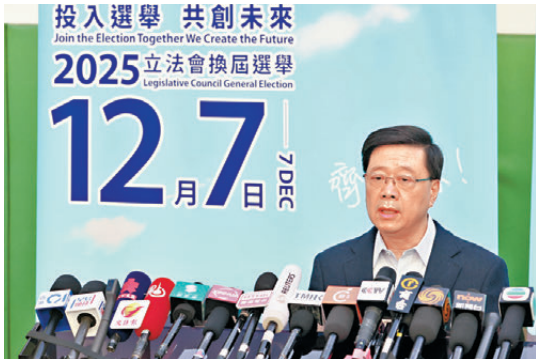
●香港特區行政長官李家超昨日投票後表示，將加快推進災後支援與重建以及成立獨立委員會。

香港文匯報訊（記者 嚴緒華、文禮願、李千尋）大埔經歷火災後，不少選民懷着助力災民重建家園的初心，步入投票站。香港特區行政長官李家超昨日投票後，也記掛着大埔的災後重建，他表示火災令人悲痛，但眼前仍有許多工作要處理，包括加快推進災後支援與重建，以及成立獨立委員會把事故原因查個水落石出。新一屆立法會召開的首次會議，政府的首個議案就會提出如何支援災民和善後重建，推動制度改革，他期望盡快落實相關工作，調查工作必然會做到公平公正，在掌握事實真相及制度缺失後，逐步推動改革措施，不會等待最終報告才作出應對，目標在最短時間內提升整體社會安全水平。