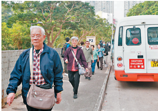
●穿樓小巴免費接載選民往返廣福邨商場與李興貴中學票站。

位於香港教師會李興貴中學的票站，其選民多來自廣福邨及宏福苑。本身受火災影響的李先生昨早與太太攜手前來投票，兩人目前正暫住粉嶺青年營舍設施。被問到為何受災要四出頻撲仍願意積極投票，李先生強調：「立法會的功能，對我們都很重要，當然要投票啦。」兩人過去每屆都必定會參與。李太太認為，特區政府和社會各