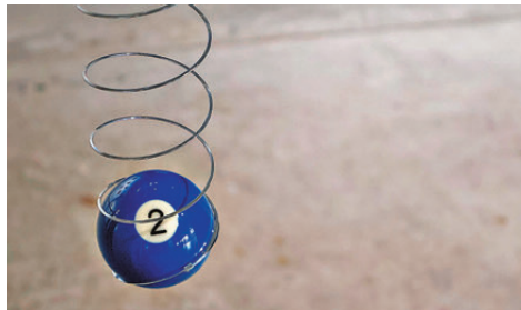
●陳嘉翹《mini soft jiggle》