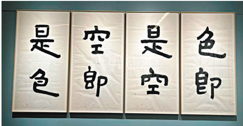
●經文中「色即是空，空即是色」兩句最為人熟知。

饒宗頤2001年創作「心經簡林」書法時，正值香港經濟低迷，他期望藉着大字《心經》，讓市民大眾一豁心目，領略經文中的智慧，離苦得樂，早日尋得內心的平靜。這次展覽秉承饒宗頤的初心，盼望為觀眾帶來心靈的啟發和領悟，以及一場真、善、美的體驗。展覽呈獻公私珍藏的饒宗頤各體書《心經》精品，包括「心經簡林」