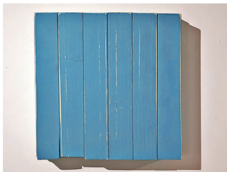
●黃浩麟《Try to remember》