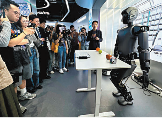
●未來產業和新興產業是廣東「十五五」的發展重點之一。圖為大灣區一家人形機器人企業。