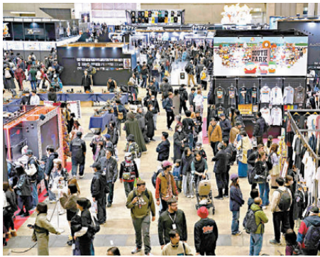
●日本民眾薪資增幅追不上通脹。

後，正面臨物價增速超過薪資增長的難題，中小企業薪資增長尤其落後。中小企業佔日本企業總數超過99%，僱用人數約佔全國七成，但在當前環境下，它們既難以將成本轉嫁，又面臨人手短缺等經營壓力。 日本首相高市早苗10月上任後，公布一項規模達21.3萬億日圓(約1.07萬億港元)的經濟振興方案，旨在抑制通脹並引導經濟重返增長。然而實質薪資持續下滑與中小企業面臨的困境，為政策落實帶來顯著難度。