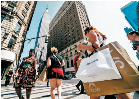
●美國消費者普遍對經濟持悲觀情緒。

服務賬單飆升，她直言「不得不用更少的錢做更多的事」，並表示對目前經濟狀況感到「筋疲力竭」。