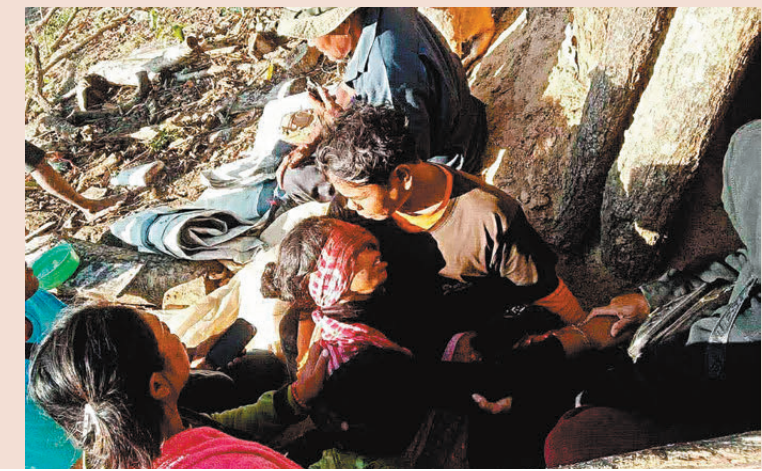
●泰國發動空襲致柬埔寨邊境民眾死傷。

柬埔寨首相洪瑪奈發聲明表示，目前首要任務是保護人民和維護主權與領土完整。柬埔寨前首相、參議院主席洪森於社媒稱，已劃定必須採取行動的報復紅線，但同時呼籲柬軍保持克制。 洪瑪奈重申泰國的襲擊行動試圖迫使柬軍還擊，從而破壞停火協議及柬泰和平聯合聲明。 泰柬7月底曾爆發邊境衝突，持續5日，雙方共有數十人死亡。兩國其後在馬來西亞等國家斡旋下達成停火協議，同意維持軍隊部署現狀，承諾不再向邊境增兵。但到11月10日，泰柬邊境發生地雷爆炸，造成兩名泰國士兵受傷，泰國決定暫停執行兩國和平聯合聲明。面對泰柬局勢惡化，馬來西亞總理安華周一呼籲雙方克制，強調東南亞地區無法承受長期爭端，陷入衝突的循環，表示馬來西亞隨時準備支援化解今次衝突。