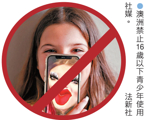
●澳洲禁止16歲以下青少年使用社媒。

聯合國教科文組織發布的《數碼平台治理準則》顯示，2023年全球社媒使用人數約為總人口的60%。世衛組織去年的報告將過度使用社媒定義為「成癮性行為模式」，《自然—人類行為》期刊研究發現，有精神健康症狀的英國青少年使用社媒時間明顯較長。網絡風險同樣不容忽視，德國一項調查顯示，55%家長表示孩子在使用社媒過程中遭受霸凌、暴力、色情和網絡誘騙的傷害。