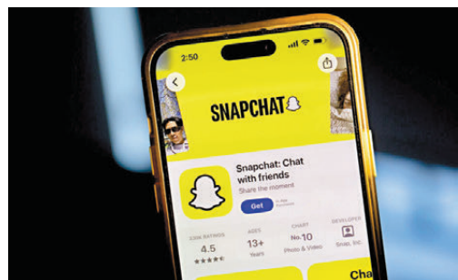
●Snapchat等平台面臨財務衝擊。 彭博社

據知情人士透露，Snapchat聯合創辦人斯皮格甚至於10月親自飛往澳洲，游說通信部長威爾斯，可見平台對此議題的重視程度，但Snapchat與威爾斯的發言人均未透露會議上談及哪些內容。