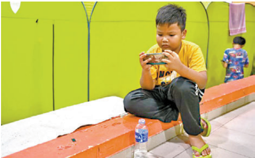
●馬來西亞計劃明年起禁止16歲以下青少年使用社媒。

社媒，此舉旨在保護青少年免受網絡霸凌、詐騙等傷害。民調機構Ipsos今年9月在馬來西亞進行的調查顯示，逾七成受訪對象支持對兒童使用社媒設限。